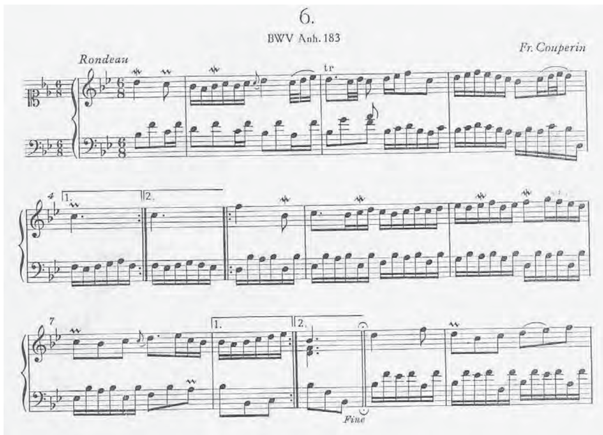
Ex.8 – O Rondeau de F. Couperin transcrito por J. S. Bach. (Fonte: O Clavierbüchlein para Anna Magdalena Bach. Ed. Bärenreiter)

Goûts-Reunis , 15 proposto musicalmente em 1724 por F. Couperin, em 1728 por J.D. Heinichen (1683-1729) e em 1752 por J.J.Quantz (1697-1773). Muito particular também é a identificação das notas finais da tônica na linha do baixo, no compasso oito (casas 1 e 2), próprias da pontuação cadencial que preparam a reprise. Note-se que Bach modificou a figuração rítmica francesa de ressonância, indicando assim, o hábito germânico para o tratamento da linguagem e articulação dos motivos rítmicos e melódicos.