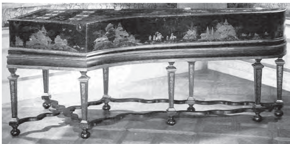
Ex.5 – Cravo com duplo manual atribuído a Mietke. Berlim, 1719. (Fonte: Chinoiserie . Madeleine Jarry. New York: 1981, p.152)

A maioria dos instrumentos anteriormente listados possuía a registração padrão com 8' e 4' no primeiro manual, 8' no segundo manual. Em alguns casos, o abafador produzia o "efeito" de alaúde em algum dos manuais e, acoplamento com sistema de gaveta. Poucos exemplares (Harrass e Hass) utilizaram um quarto registro: o 16', muito adequado ao repertório germânico com tradição