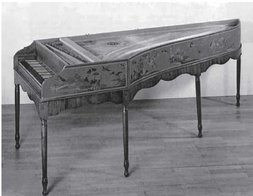
Ex.4 – Cravo Fleischer. Hamburgo, 1710.