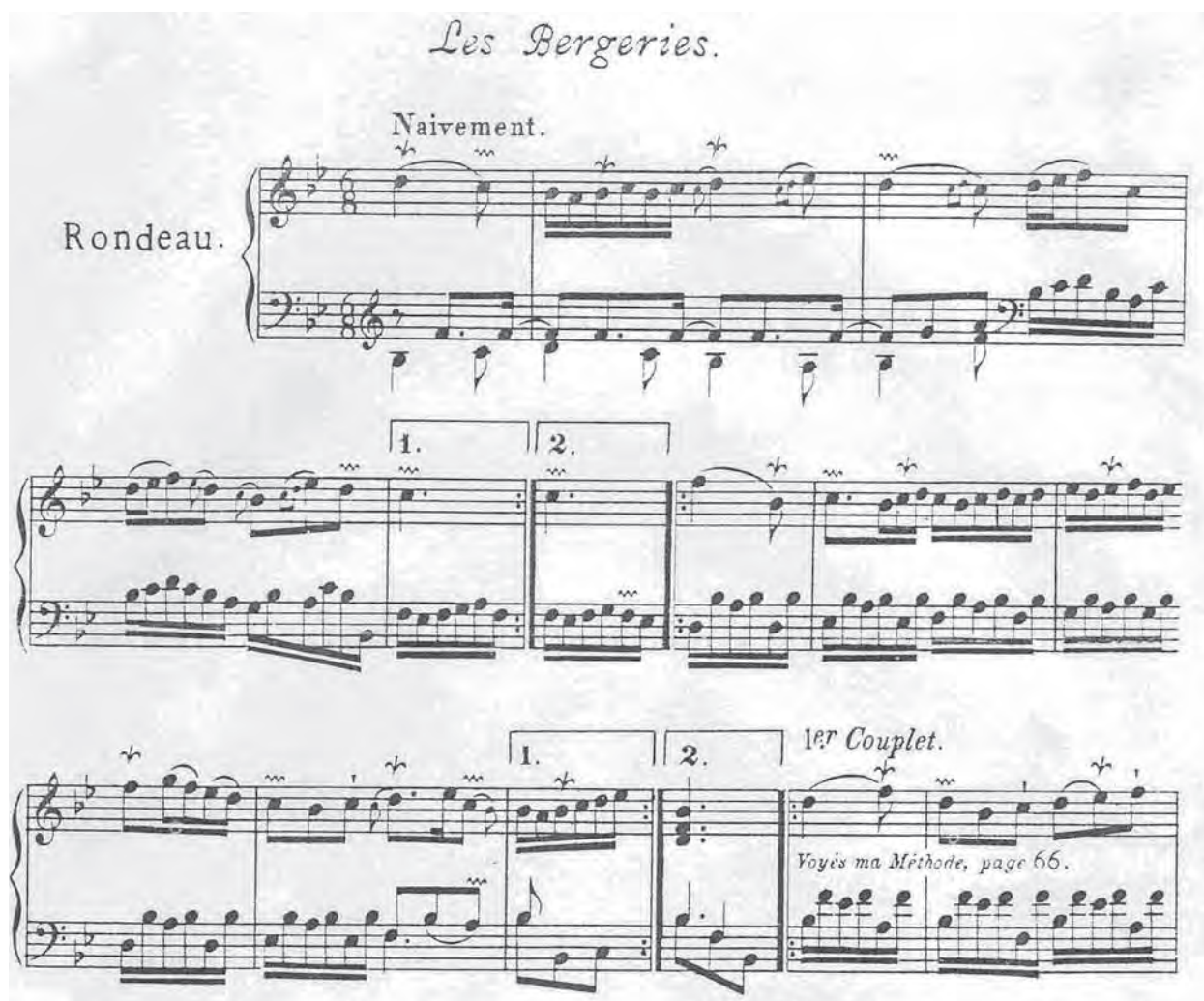
Ex.7 – Rondeau. Les Bergeries. Ordre Sixième de F. Couperin.

De notável interesse ainda é a realização transcrita dos Coulés – ornamentos franceses específicos – na linha melódica do compasso dois, inseridos ao contorno em semicolcheias, revelando uma não sedimentação do Les