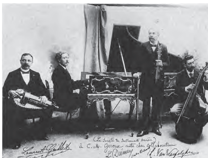
Ex.3 – A Société des Instruments Anciens – Paris, 1895.

A "escola" de construção dos cravos alemães tem, por outro lado, num primeiro momento, evidente e forte influência da tradição italiana. O desenho desenvolvido pelos italianos privilegia – ao contrário dos exemplares franceses – os primeiros harmônicos na produção do som após o pinçamento da corda. Assim, em sua extensão, nota-se claro favorecimento para a execução da polifonia, elemento este, provavelmente, identificado pelos compositores alemães e admitido como característico de sua escola nos séculos XVII e XVIII, para a evidência e entrelaçamento do contraponto composicional. Aliado a isto, percebe-se ainda a presença da escola de construção flamenga e mais precisamente da família Ruckers, que influencia a tradição de construção em todo continente – incluindo-se a já citada tradição francesa – que desenvolveu características próprias, mas, excetuando-se as tradições das penínsulas: itálica e ibérica. Como prova desta troca de influências, mencionamos, entre outros, o exemplar de Johann Christopher Fleischer (Hamburgo, 1710) atualmente no Museu da Filarmonia de Berlim (Ex.4).