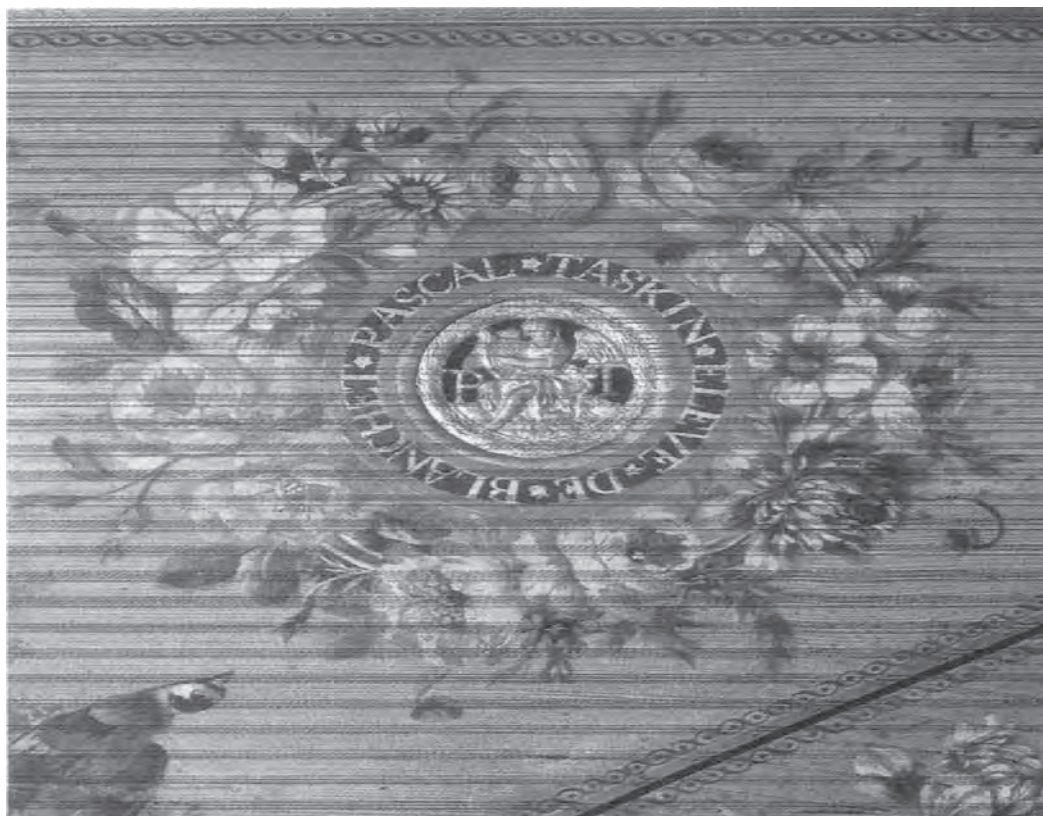
Ex.2 – Rosácea do cravo Taskin, 1769.