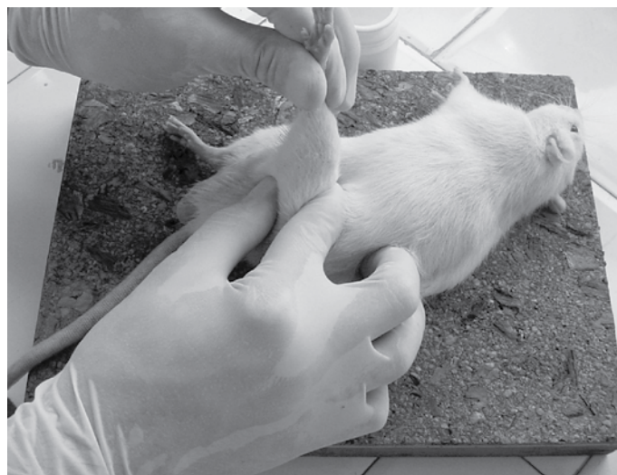
Figura 1. Modelo animal de imobilização de membro inferior (MI) esquerdo em posição encurtada por órtese contentora estática.

Os animais experimentais foram sedados com halotano a 3%, vaporizado em câmara de contenção. Sob anestesia, o encurtamento do músculo bíceps femoral esquerdo foi realizado pela técnica de imobilização na posição encurtada por órtese contentora estática (10-12) . Este tipo de imobilização está baseado na moldagem de uma órtese em material termoplástico flexível de 2,4mm de espessura, OMEGA ® MAX 3/32" (North Coast Medical, Morgan Hill, CA, EUA). Os grupos IMOB e ALONG tiveram a órtese contentora moldada diretamente no membro inferior esquerdo (MIE) de cada animal, sendo colocada de forma que a pata traseira dos ratos permanecesse em flexão completa (joelho e tornozelo), isto é, posição de encurtamento do músculo bíceps femoral, a qual foi mantida por 21 dias consecutivos, conforme ilustrado na figura 1. O modelo de imobilização utilizado neste estudo foi baseado no proposto por Booth e Kelso (10) , readequado para um membro por Matheus e Shimano (11) , com adaptação do material utilizado para construção da órtese.