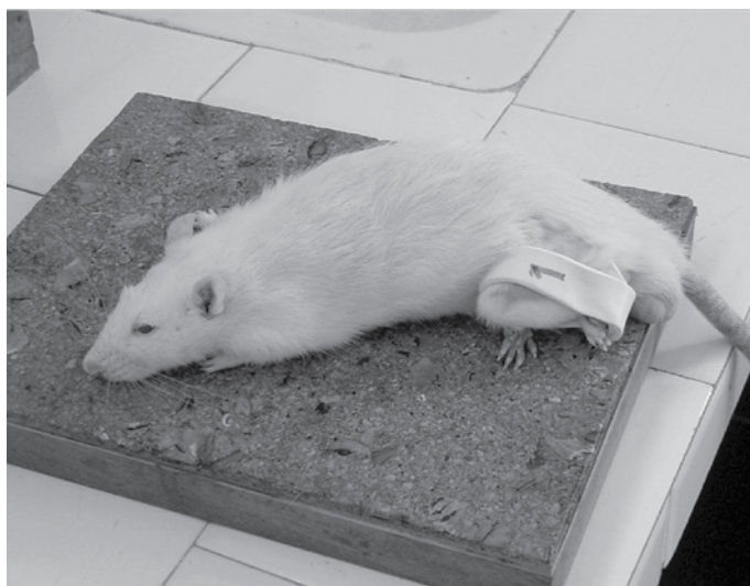
Figura 2. Exercício de alongamento passivo (estático) aplicado por oito segundos em membro inferior esquerdo de ratos após 21 dias de imobilização encurtada por órtese estática.

da amplitude articular impedida pela resistência dos tecidos moles (cápsulas, ligamentos e tendões do joelho e tornozelo). O exercício de alongamento estático foi aplicado no membro inferior E, uma vez ao dia, no período matutino, durante oito minutos (2) por três semanas consecutivas, resultando em um total de 21 dias de alongamento passivo (figura 2). No grupo LIVRE, após o período de imobilização de 21 dias, foram retiradas as órteses, permitindo movimentos livres em suas gaiolas por mais 21 dias. Após este período, os animais foram sacrificados com uma dose letal de anestésico (Pentobarbital sódico) e então realizados os procedimentos cirúrgicos e coleta do músculo bíceps femoral e do osso fêmur. Em todos os animais, foi realizada uma incisão cirúrgica de 5,0cm na região posterior da coxa da pata traseira direita, na qual o músculo bíceps femoral direito foi isolado e retirado de suas enteses proximal e distal para pesagem úmida e, na sequência, o processamento da rotina histológica. O fêmur esquerdo (homolateral) foi desarticulado e removido para medidas de comprimento (mm), realizadas a partir do ponto mais proximal da cabeça femoral até o sulco intercondilar da articulação do joelho E, utilizando-se um paquímetro digital (Mitutoyo Sul Americana Ltda, Suzano, SP, Brasil).