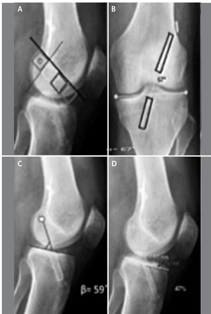
Figura 2. A) Radiografia perfil mostrando a marcação de um quadrante femoral (verde); B) Radiografia AP mostrando o ângulo \alpha ; C) Radiografia perfil mostrando o ângulo \beta ; D) Radiografia perfil mostrando a marcação do túnel tibial pelo método de Stäubli e Rauschnig 13 .