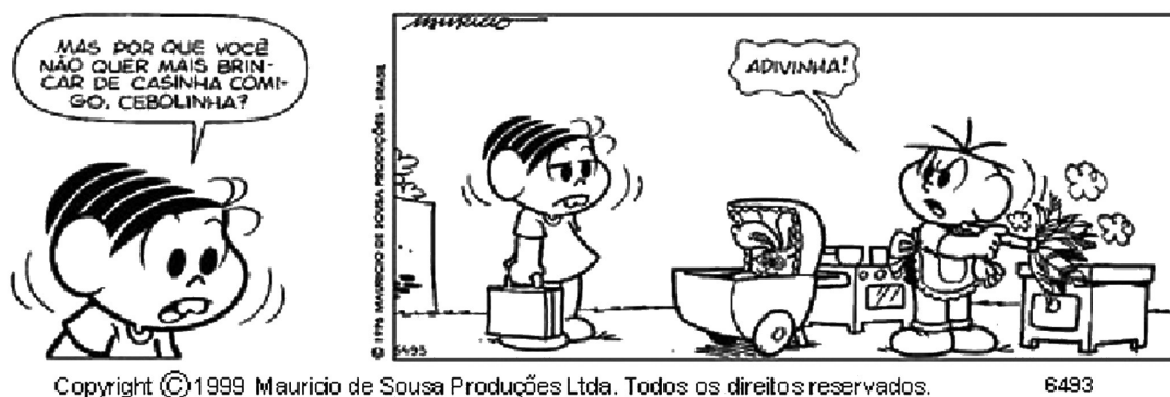
Figura 3- Tirinha colada no calendário do mês de outubro.

Fonte: Maurício de Sousa Produções Ltda.