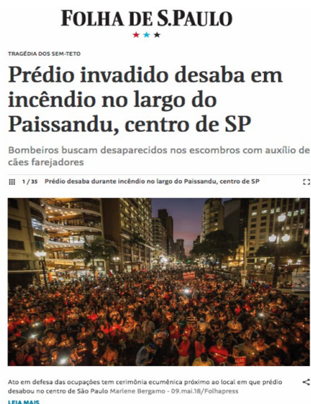
Figura 1 – Notícia da Folha de S. Paulo

Las cicatrices nos recuerdan que nuestro pasado es real. Kader Attia