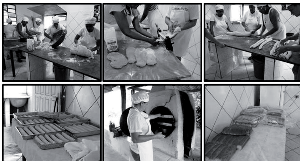
Figura 3 - Produção de pães feita pelo Grupo de Mulheres Amigas do Cerrado no Assentamento Facão/ Furna São José

A produção é feita em etapas estabelecidas pelo grupo, em que cada mulher tem uma função específica, desde a coleta até o produto final. As atividades são divididas de modo que não sobrecarregue nenhuma delas. Dentro deste processo, é feito primeiramente o pão (Figura 3) e, em seguida, a bolacha (Figura 4), para o melhor aproveitamento do aquecimento do forno. Essa produção ocorre todas as terças-feiras, com duração aproximada de 8 a 10 horas, e grande parte do processo é feito manualmente ou empregadas ferramentas desenvolvidas especificamente para facilitar o processo de produção, como por exemplo, o quebrador dos frutos, que quebra em média 2 kg de fruto por dia, que é a quantidade necessária para a produção, ou variando de acordo com a demanda.