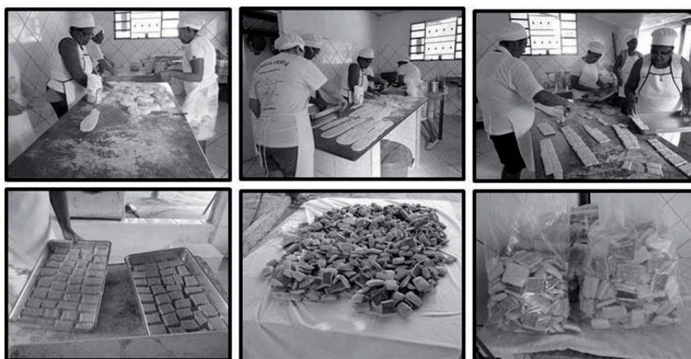
Figura 4 - Produção de bolachas realizada pelo Grupo de Mulheres Amigas do Cerrado no Assentamento Facão/ Furna São José.

do Brasil, eram mais de 185 mil crianças e idosos beneficiados por convênios firmados para a comercialização dos produtos gerados na cadeia do cumbaru. Mior (2005) destaca que esses processos são um conjunto de atividades de agregação de valor, pautadas na agroindustrialização de produtos caseiros, concretizando como novas estratégias de organização e valoração das produtoras, incluindo-as nas cadeias produtivas, valorizando-as; entretanto ainda há uma necessidade de políticas públicas mais aplicáveis e menos burocráticas.