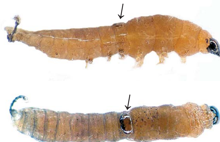
Fig. 2. Lagartas de T. absoluta após alimentação em folíolos de tomateiro tratados com o triterpeno 24-metilenocicloarta-3 \beta -ol (TRIT-1) isolado de folhas de T. pallida . As setas indicam o anelamento do abdome pela exúvia (acima) bem como a posição da placa protorácica por ocasião da morte das lagartas (abaixo).