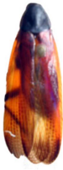
Figuras 8. Ischnoptera bicolorata sp. nov. Holótipo macho