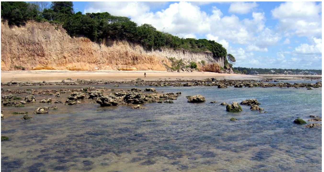
Figura 2. Vista parcial dos recifes do Cabo Branco, João Pessoa, Paraíba.