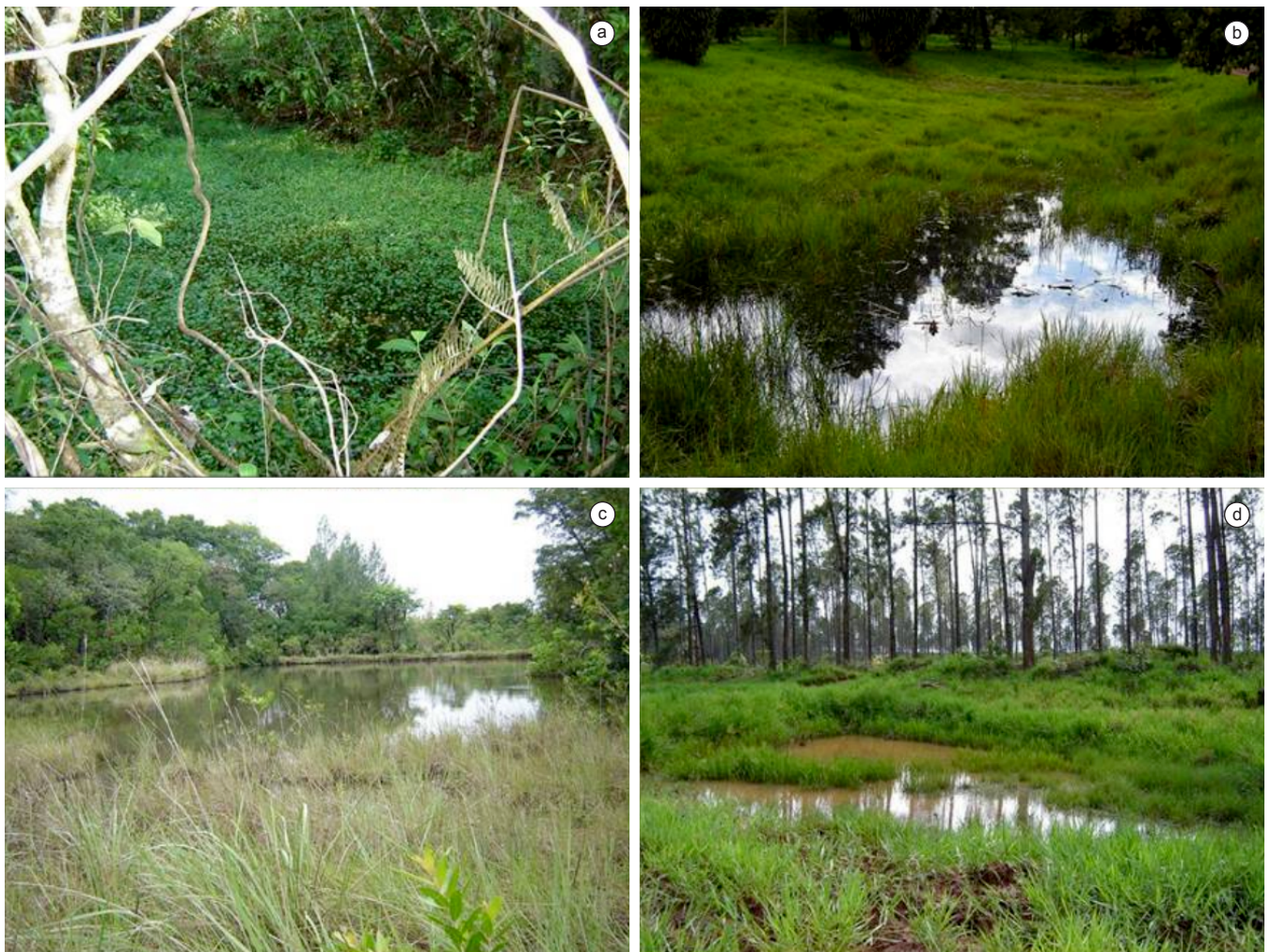
Figura 2. Quatro corpos d'água estudados na EEA e na FEA. a,c) permanentes, b,d) temporários.