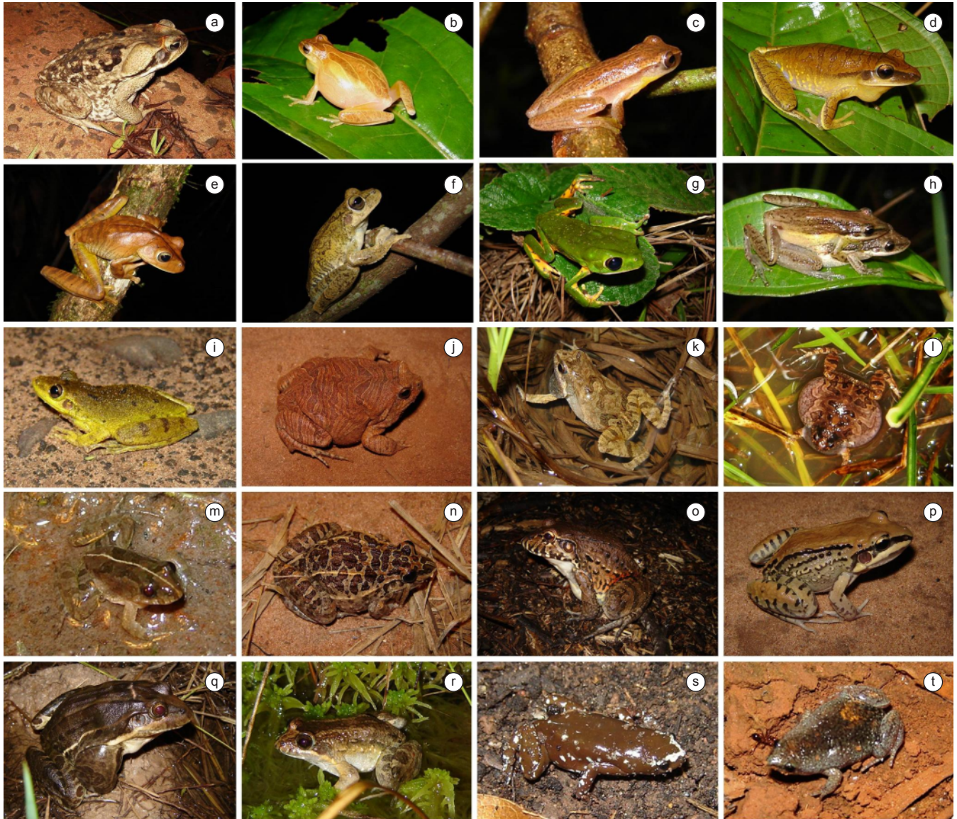
Figura 3. Espécies de anfíbios anuros encontradas na EEA e na FEA entre outubro de 2005 e outubro de 2007. a) Rhinella schneideri , b) Dendropsophus minutus , c) D. nanus , d) Hypsiboas albopunctatus , e) H. faber , f) H. lundii , g) Phyllomedusa tetraploidea , h) Scinax fuscomarginatus , i) S. fuscovarius , j) Eupemphix nattereri , k) Physalaemus cuvieri , l) Physalaemus marmoratus ; m) Pseudopaludicola cf. mystacalis , n) Leptodactylus fuscus , o) L. labyrinthicus , p) L. mystacinus , q) L. ocellatus , r) L. podicipinus , s) Chiasmocleis albopunctata e, t) Elachistocleis sp.2.