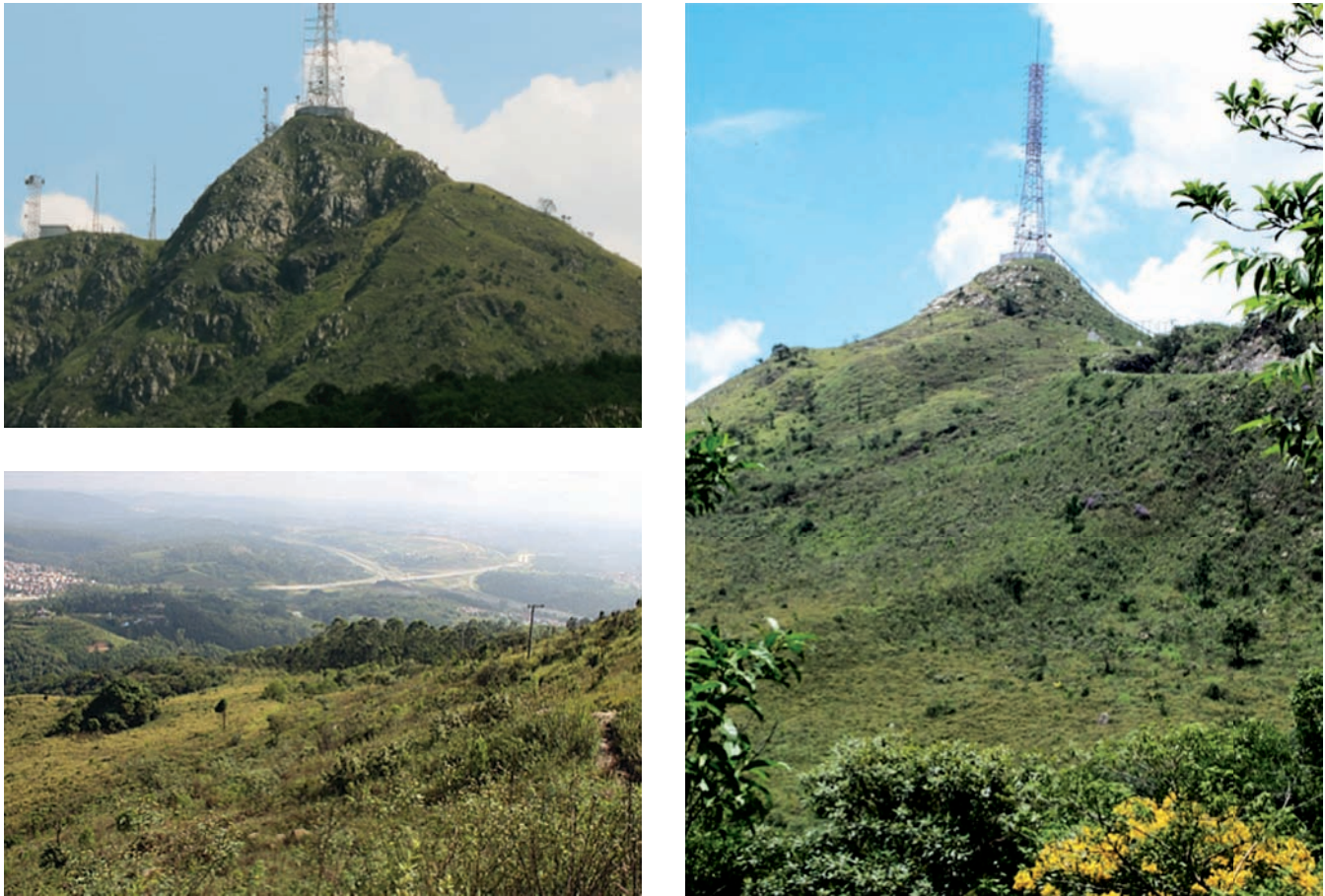
Figura 2. Aspectos da vegetação de “campo” e dos afloramentos de rocha no Parque Estadual do Jaraguá, São Paulo - SP.