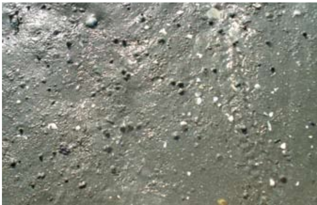
Figura 14. Baía do Araçá: dejetos na superfície do sedimento areno-lamoso que caracteriza a presença do poliqueta Laeonereis culveri . Foto: A.C.Z. Amaral (07/2009).

Figure 16. Araçá Bay: signs of the clam Macoma in muddy sand flat, intertidal zone. Photo: S.A. Nallin (05/2009).