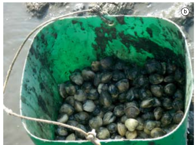
Figura 19. Baía do Araçá: a) caiçara coletando o berbigão Anomalocardia brasiliana em sedimento areno-lamoso na região entremarés; b) resultado da coleta de A. brasiliana em poucas horas de trabalho. Foto: A.C.Z. Amaral (07/2009).

Figure 19. Araçá Bay: a) a Caiçara (native inhabitants in the Southeastern coast of Brazil) hand digging the bivalve Anomalocardia brasiliana out of the muddy sand flat, intertidal zone; b) clams ( A. brasiliana ) hand caught in a few hours of work. Photo: A.C.Z. Amaral (07/2009).