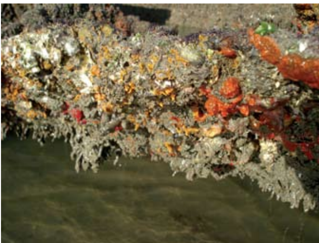
Figura 9. Baía do Araçá: costão rochoso da Ilha Pernambuco, zona inferior da região entremarés. (07/2009).

Figure 8. Araçá Bay: detail of the mangrove vegetation, high intertidal zone. (07/2009).