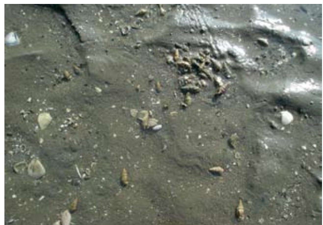
Figura 18. Baía do Araçá: gastrópode Cerithium atratum na região entremarés. Foto: A.C.Z. Amaral (07/2009).

Figure 15. Araçá Bay: burrow opening of the crab Uca , intertidal zone, mangrove vegetation near Pernambuco Island. Photo: A.C.Z. Amaral (07/2009).