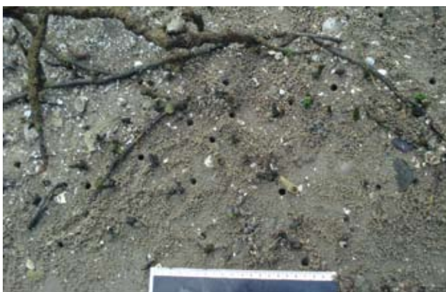
Figura 15. Baía do Araçá: aberturas de galerias do crustáceo Uca , região entremarés, núcleo de manguezal localizado próximo à Ilha Pernambuco. Foto: A.C.Z. Amaral (07/2009).

Figure 17. Araçá Bay: tube of the polychaete Diopatra aciculata in muddy sand flat, intertidal zone. Photo: A.C.Z. Amaral (07/2009).