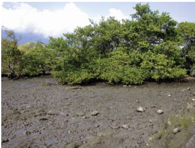
Figura 4. Baía do Araçá: vegetação do núcleo de manguezal localizado nas proximidades da Ilha Pernambuco. Foto: S.A. Nallin (05/2009).

Figure 5. Araçá Bay: view of the interior of the mangrove located near Pernambuco Island. Photo: S.A. Nallin (05/2009).