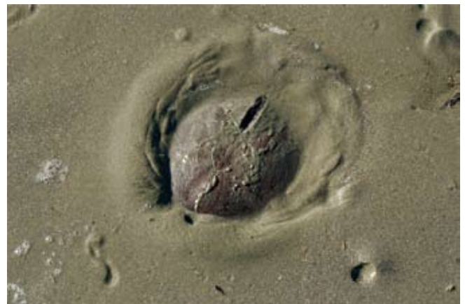
Figura 12. Baía do Araçá: bolacha-do-mar Encope emarginata em sedimento areno-lamoso, zona inferior da região entremarés. Foto: A.E. Migotto (07/2009).

Figure 11. Araçá Bay: rocky shore of Pernambuco Island, showing sea anemones Anemonia sargassensis . Photo: A.C.Z. Amaral (07/2009).