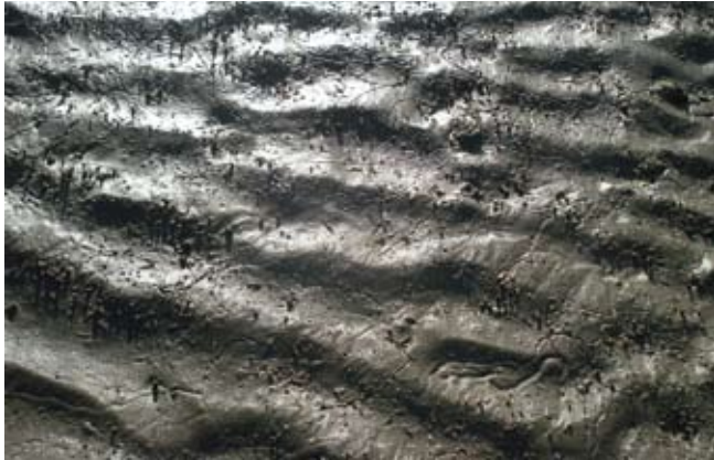
Figura 13. Baía do Araçá: pequenos tubos do crustáceo Kalliapseudes e marcas do gastrópode Olivella minuta em sedimento areno-lamoso na região entremarés. Foto: A.C.Z. Amaral (07/2009).

Figure 13. Araçá Bay: small tubes of the crustacean Kalliapseudes , and sinuous trail marks of the gastropod Olivella minuta in muddy sand flat, intertidal zone. Photo: A.C.Z. Amaral (07/2009).