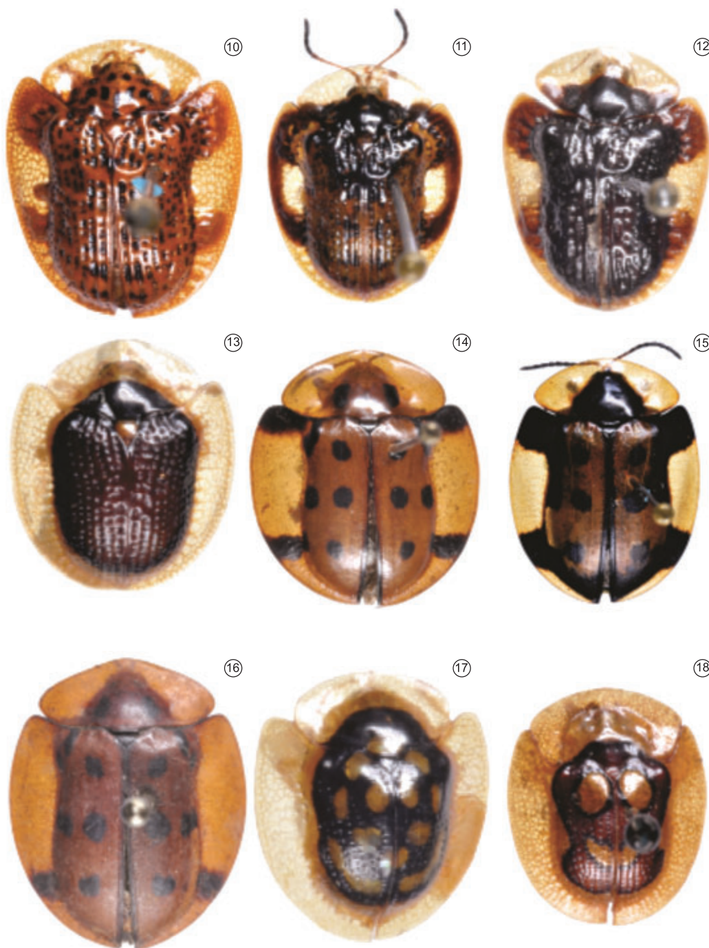
Figuras 10-18. 10) Microctenochira aciculata ; 11) Microctenochira optata ; 12) Microctenochira stigmatica ; 13) Microctenochira villica ; 14) Oresita picta ; 15) Oresita picta ; 16) Oresita picta ; 17) Plagiometriona ambigena ; 18) Plagiometriona clandestina .