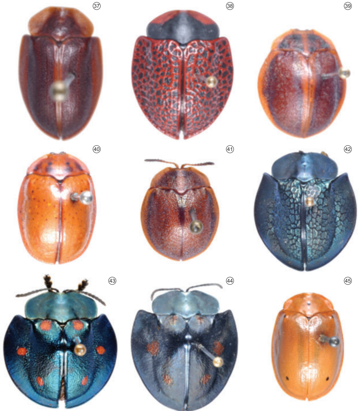
Figuras 37-45. 37) Anacassis fuscata ; 38) Botanochara impressa ; 39) Chelymorpha clathrata ; 40) Chelymorpha infecta ; 41) Chelymorpha marginata ; 42) Cyrtanota cyanea ; 43) Cyrtanota sexpustulata ; 44) Cyrtanota similata ; 45) Hilarocassis albida .