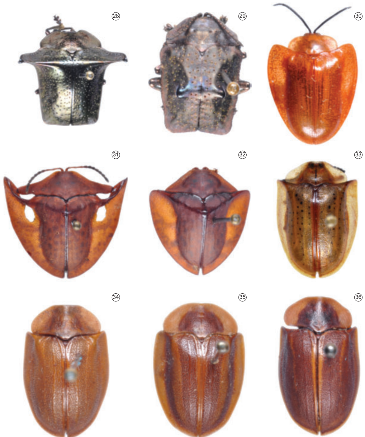
Figuras 28-36. 28) Omocerus truncatus , 29) Polychalca platynota ; 30) Calyptocephala nigricornis ; 31) Acromis spinifex (♂); 32) Acromis spinifex (♀); 33) Anacassis dubia ; 34) Anacassis fuscata ; 35) Anacassis fuscata ; 36) Anacassis fuscata .