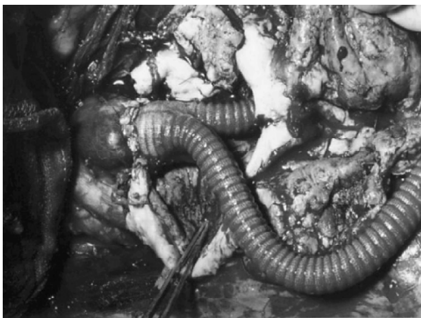
Figura 3 - Aspecto intra-operatório de revascularização aorto-bifemoral, em caso de aneurisma bilateral de artérias ilíacas comuns, com manutenção da perviedade da artéria ilíaca interna esquerda através de anastomose no nível da bifurcação da artéria ilíaca comum esquerda

Quanto às complicações intra-operatórias, não tivemos nenhum caso de lesão venosa iatrogênica, mas houve um caso de lesão ureteral unilateral, em um paciente com um grande aneurisma de artéria ilíaca comum, que englobava o ureter na sua parede. O ureter foi restaurado no intra-operatório, não trazendo outras complicações pós-operatórias ao paciente.