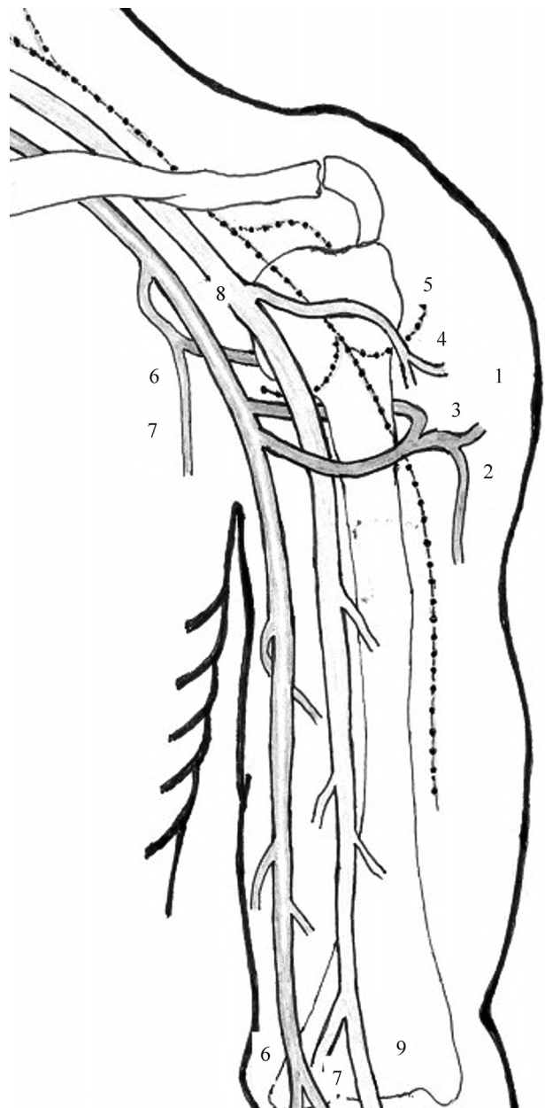
Figura 7 - Representação esquemática do complexo neurovascular deltoideano e eventuais sítios de acidentes medicamentosos. Lesões geradas por injeção intramuscular no músculo deltoide: 1) paniculite e miosite medicamentosas; 2) embolia cútis medicamentosa; 3) arterite cútis medicamentosa; 4) flebite cútis medicamentosa; 5) neurite cútis medicamentosa; 6) embolia à distância; 7) arterite à distância; 8) flebite profunda; 9) vaso espasmo reflexo

Não há tratamento específico para a lesão da região deltoidea nem para a isquemia da mão. Entretanto, na maioria dos pacientes, é possível minimizar as consequências nocivas do acidente. As medidas terapêuticas aqui adotadas variaram conforme a apresentação e a evolução de cada caso. O combate à dor local foi realizado com medidas paliativas (anestésico cutâneo, frio, calor, etc.) sem