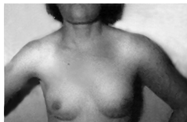
Figura 2 - Edema de membro superior após injeção de diclofenaco na massa deltoidea; flebite cútis medicamentosa e tromboflebite medicamentosa à distância

Após a injeção deltoidea de substância em veículo aquoso, três pacientes apresentaram pequena reação local com dor de média intensidade. Logo depois, o local da injeção ficou congesto e cianosado. Ao fim de algumas horas (12 horas em um paciente e na manhã seguinte nos outros dois), o membro superior edemaciou desde o ombro e a escápula até os dedos. Os movimentos do membro foram parcialmente prejudicados, houve dor difusa de média intensidade, coloração levemente azulada da pele de todo o membro e turgência das veias superficiais (Figura 2). O local da injeção estava tumefeito, sem sinais de necrose cutânea. Não foi feito bloqueio simpático. Com o uso de