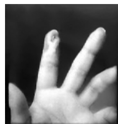
Figura 5 - Lesão residual da necrose de ponta de dedo desencana-deada por embolia cútis medicamentosa no deltoide homolateral