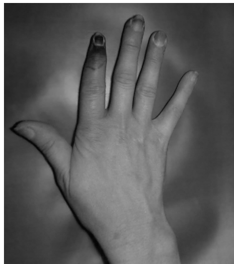
Figura 4 - Necrose de extremidade dos dedos após injeção intramuscular de bismuto no deltoide

Esta forma de acidente parece ser ocasionada: 1) pela entrada fortuita da substância oleosa na luz da(s) artéria(s) circunflexa(s), com oclusão arteríolo-arterial e bloqueio da