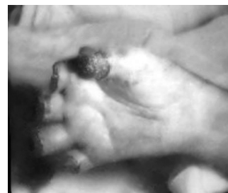
Figura 6 - Embolia cútis medicamentosa deltoideana e isquemia de mão. Amputação cirúrgica dos dedos necrosados