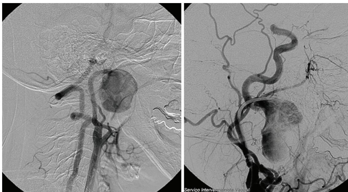
Figura 2. Arteriografia seletiva mostrando o aneurisma de artéria carótida interna, próximo à base do crânio.

dia de PO, e no quinto dia, recebeu alta. No retorno, após 15 dias, apresentava ligeiro edema facial, sem sinais de paralisia facial ou de outros nervos. O exame ultrassonográfico com Doppler de controle realizado em 30 dias e em 6 meses identificou o Stent bem posicionado na bifurcação carotídea e presença de fluxo em todo o trajeto da ACI com onda e velocidades diastólica e sistólica dentro dos valores de referência e simétricas, quando comparados os dois lados.