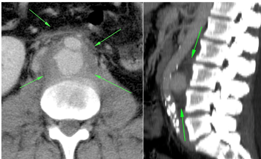
Figura 1. Tomografia computadorizada evidenciando aneurisma de aorta abdominal com sinais sugestivos de infecção.

O paciente foi encaminhado à Unidade de Terapia Intensiva (UTI), onde permaneceu por 8 dias.