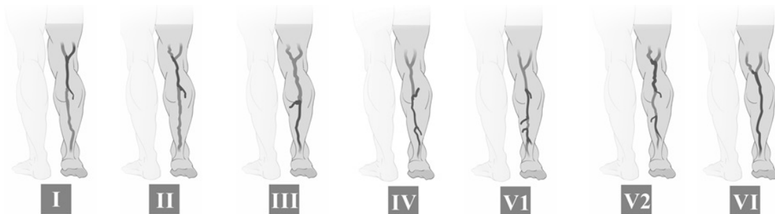
Figura 2. Padrões de refluxo da veia safena parva: I ) Padrão de refluxo em perijuncional; II ) Padrão de refluxo proximal; III ) Padrão de refluxo distal; IV ) Padrão de refluxo segmentar; V1 ) Padrão de refluxo multissegmentar sem refluxo em JSP; V2 ) Padrão de refluxo multissegmentar com refluxo em JSP; VI ) Padrão de refluxo difuso.