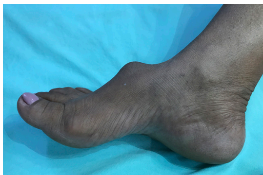
Figura 1. Massa pulsátil, compressível e dolorosa sobre o dorso do pé direito.

Paciente de 49 anos, sexo feminino, relata aparecimento de uma massa pulsátil no dorso do pé direito há aproximadamente 3 anos, apresentando crescimento progressivo e dor no decorrer dos últimos