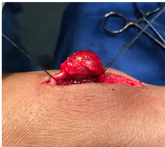
Figura 3. Exposição cirúrgica de um aneurisma sacular da artéria dorsal do pé direito com coto proximal e distal reparados.