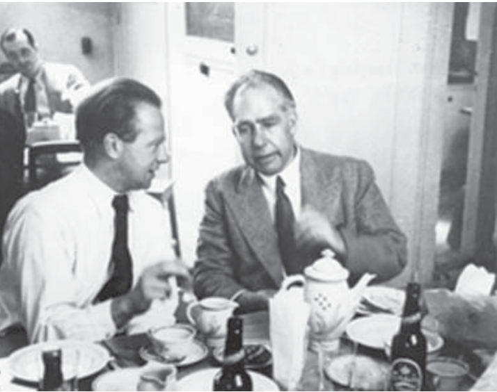
Figura 5. Heisenberg e Bohr, 1935 ou 1936. (Fonte: http://www.aip.org/history/heisenberg/po8.htm ).

Outro motivo, que distancia Heisenberg das “bênçãos do Círculo de Viena”, pode ser aduzido a partir do seguinte trecho: