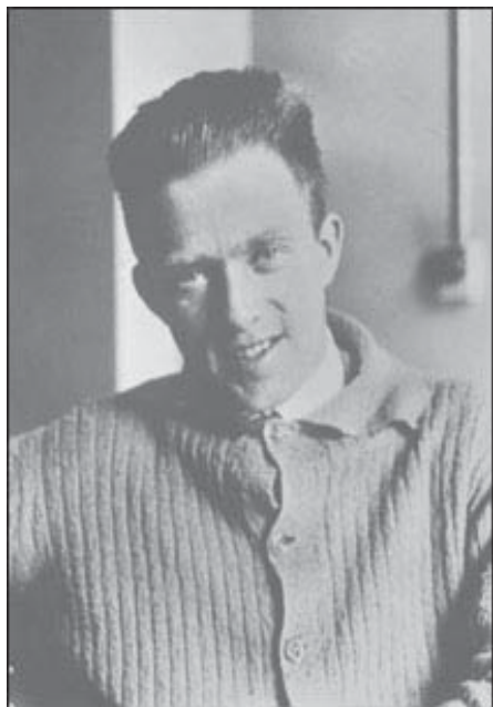
Figura 1. Heisenberg em Göttingen, 1924.

Bohr, na década de 1930, ministrou palestras para os mais variados públicos, relacionando a noção de complementaridade com um sem-número de temas. Em 1933, ele proferiu a palestra “Luz e vida” na abertura do Congresso Internacional sobre Terapias através da Luz. Em 1937, participou do Congresso de Física e Biologia em Bolonha e, um ano depois, discursou no Congresso Internacional de Ciências Antropológicas e Etnológicas, em Copenhague, discorrendo sobre “Filosofia natural e culturas humanas” (cf. Bohr, 1995).