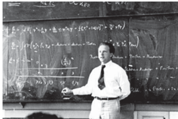
Figura 4. Heisenberg em sala de aula em 1936.

O criador da teoria da relatividade não foi o único alvo das críticas de Heisenberg. Durante a década de 1950, renasceram certas críticas à Interpretação de Copenhague, que a essa altura já era hegemônica. Se até esse momento os críticos se limitavam a poucos oponentes, o pós-guerra trouxe algo que não havia vingado antes: a elaboração de uma interpretação concor-