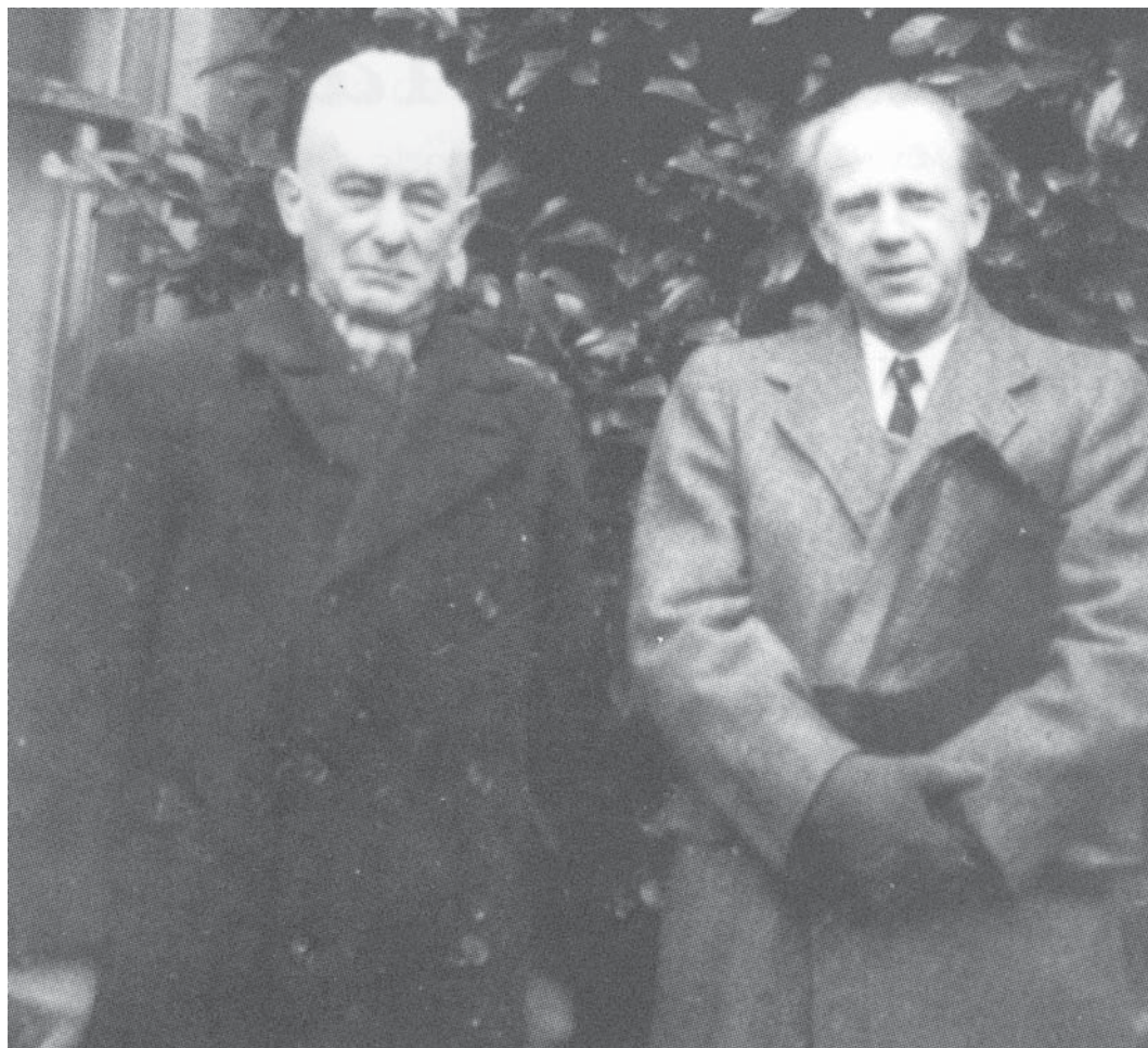
Figura 6. Max Born e Werner Heisenberg discordavam profundamente de Einstein a respeito da mecânica quântica.

grande parte do que é considerado como Interpretação de Copenhague; 24 a concepção de um ponto de vista unitário relativo aos físicos do eixo Copenhague–Göttingen seria um “mito pós-guerra”, uma criação de Heisenberg em 1955, com a introdução do termo “Interpretação de Copenhague”. 25