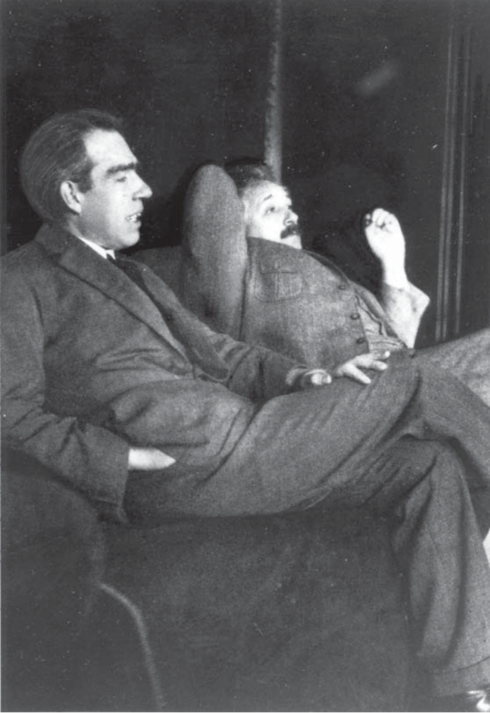
Figura 3. Niels Bohr e Albert Einstein, fotografados pelo físico austríaco Paul Ehrenfest por volta de 1927. (Fonte: Robson, 2005, p. 100).

A filosofia grega procurava um princípio unificador de todos os fenômenos observados no mundo, uma espécie de “matéria cósmica, vale dizer, uma substância universal que passaria por todas as transformações, da qual todas as coisas emergiriam para depois a ela retornar” (Heisenberg, 1995, p. 113). De Tales, passando por Demócrito e até Aristóteles, o conceito de matéria ligava-se a essa tentativa de compreender a totalidade do mundo por meio de um princípio fundamental de unificação – a arché . Séculos depois, Descartes funda uma filosofia baseada na oposição entre matéria e espírito e, assim, o conceito de matéria sofre uma transformação: no lugar da totalidade unificada, a ruptura.