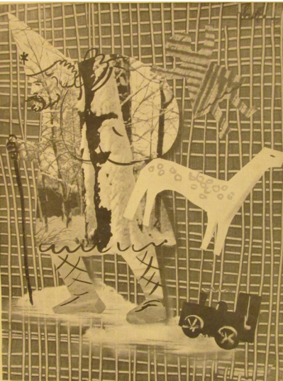
Figura 3: Bramante Buffoni, composição , dezembro de 1933. La Rivista Illustrata Popolo d'Italia , n. 12, Ano XII, p. 47.

4. Catálogo Esposizione dell'Aeronautica Italiana , mostra ocorrida no Palazzo dell'Arte. Documentação do Arquivo Histórico da Triennale di Milano, Palazzo dell'Arte. Consulta feita em novembro de 2018.