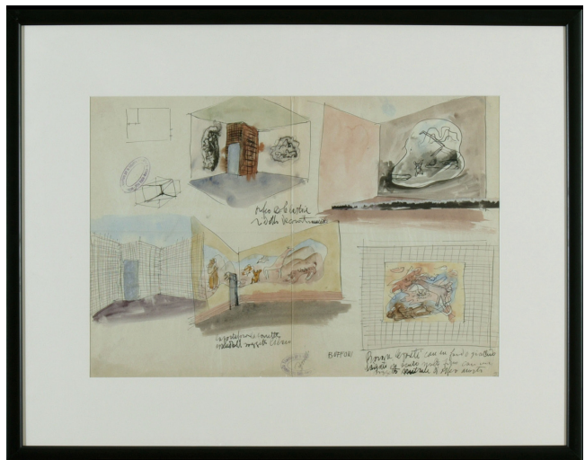
Figura 4: Bramante Buffoni, Bozzetto per decorazione di sala , 1934. china e têmpera sobre papel, 33 x 49 cm. Musei Civici di Monza, Monza, Itália.

A presença de Buffoni em Milão certamente foi de grande valia para seus avanços profissionais na década de 1930. Em 1936, Buffoni participou da VI Triennale di Milano , dessa vez não mais como aluno, mas como um artista em prestigioso começo de carreira. Nessa edição, estão registradas três inserções de Buffoni: um painel na galeria de arte decorativa, assinada pelo arquiteto Renato Camus (1891-1971), desenhos para os objetos expostos na seção da ENAPI (Ente Nazionale per l'Artigianato e le Piccole Industrie) e um mural, feito em conjunto com o pintor Leonardo Spreafico (1907-1974), premiado no concurso para a decoração de uma sala de jantar na seção de mobiliário (fig. 5). Naquele mesmo ano, Spreafico e Buffoni também venceram um concurso para um afresco na estação marítima de Nova York, lançado pela Società di Navigazione Italia (fig. 6). Não foram encontradas