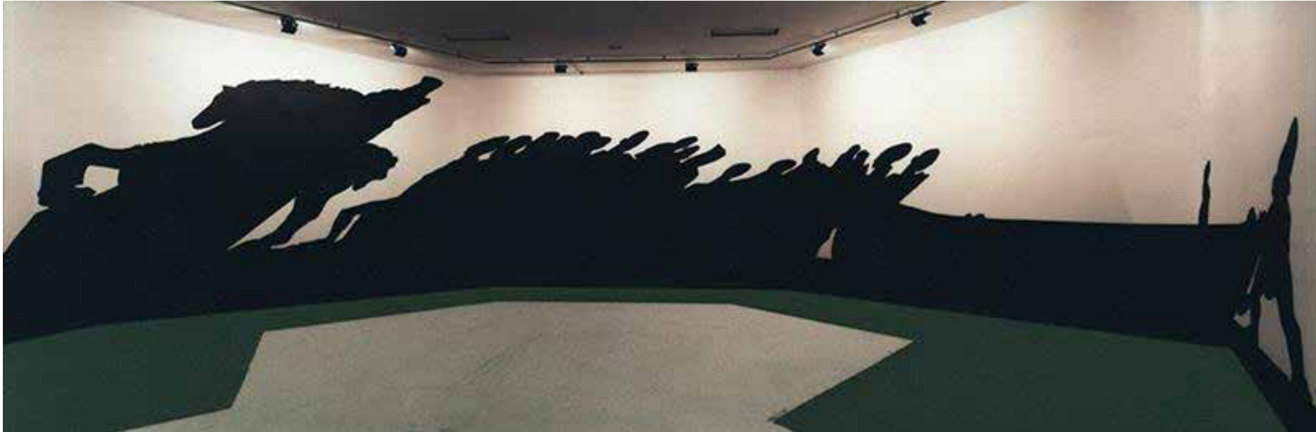
FIGURA 2. Regina Silveira, Monudentro , 1987. Vinil adesivo, 160 m 2 . Vista da instalação na mostra “Trama do Gosto” (1987), Fundação Bienal de São Paulo. Fonte: < https://reginasilveira.com/filter/instala%C3%A7%C3%A3o/MONUUDENTRO >.

junto às paredes. De modo que a sombra nas paredes era projetada por um objeto ausente, estratégia que a artista vinha explorando já havia alguns anos. 22