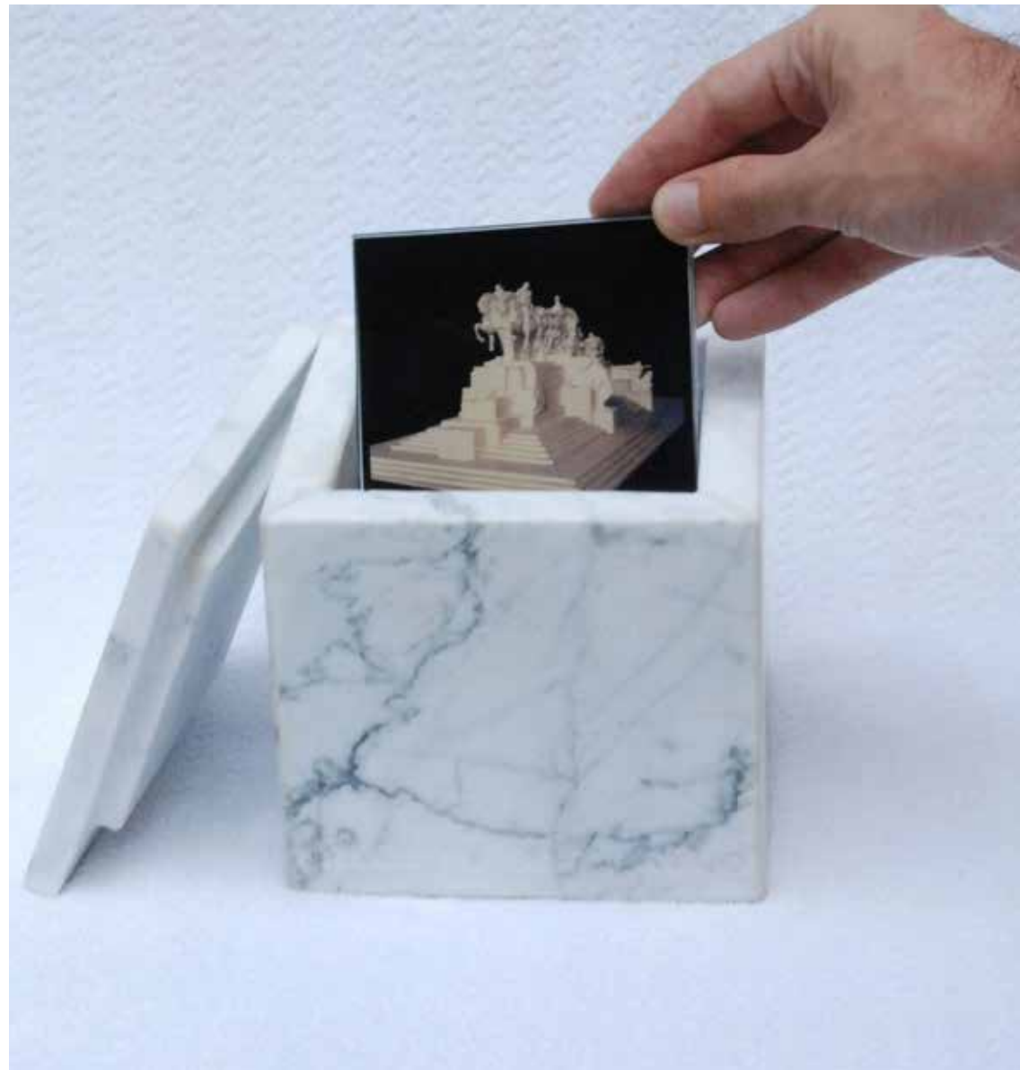
FIGURA 4. Fernando Piola, Projeto São Paulo , 2010. Fotografias em cores sobre papel montadas em acrílico e acondicio- nadas em caixa de mármore com gravação em baixo relevo feita a laser .