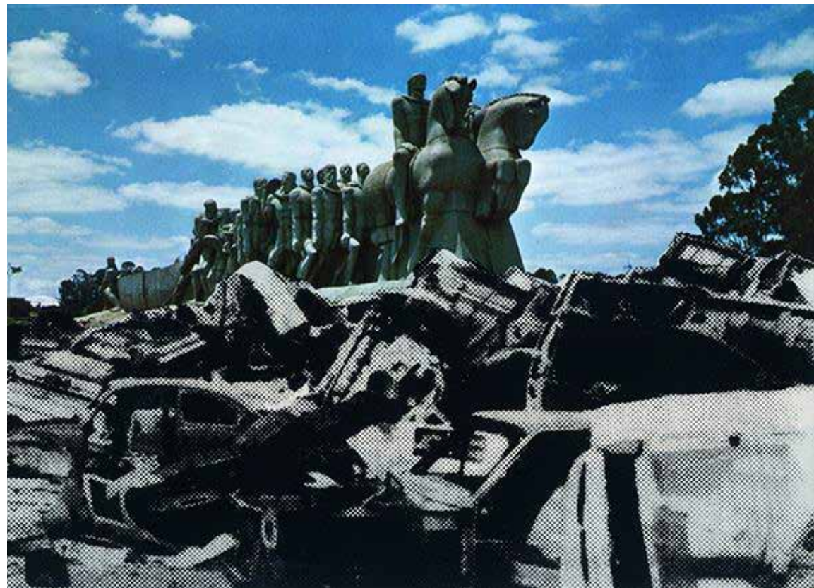
FIGURA 3. Regina Silveira, Brazil Today , Natural Beauties , 1977. Serigrafia sobre cartão postal, 10,5 x 15 cm. Fonte:< https://reginasilveira.com/ BRAZIL-TODAY >.

Álvares Cabral. Mas a estrutura formal da composição também permite pensar que o Monumento às Bandeiras se encontra no topo da pilha de automóveis, como se fosse mais uma carcaça depositada em algum ferro velho da cidade, após ter sido retirado da praça Armando de Salles Oliveira, assim como em “Proposta para Monudentro ”. É nesse sentido que esses dois trabalhos podem ser lidos como complementos de Monudentro , pois apontam um deslocamento imaginário do monumento do local onde está desde 1953.