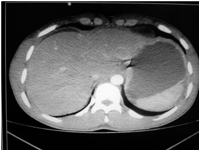
Figura 1. Tomografia computadorizada mostra grande quantidade de líquido livre