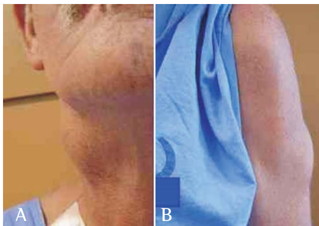
Figura 1 - A) Nódulo subcutâneo em região cervical direita (cerca de 5cm); B) Nódulo subcutâneo em braço esquerdo (cerca de 5cm)

Foi realizada fibrobroncoscopia com lavado broncoalveolar e biópsia transbrônquica. Porém,