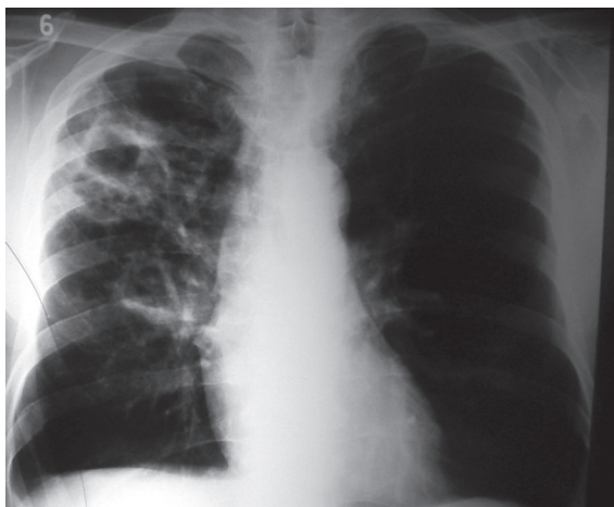
Figura 2 - Radiografia de tórax em incidência pósterio-anterior evidenciando lesões (cavitação) nos lobos médio e superior do pulmão direito.

cavitação nos lobos médio e superior do pulmão direito. (9) O hemograma revelou o seguinte: volume globular, 36,8%; hemoglobina, 12,4 g/dL; leucócitos, 9.130 \times 10^3/\mu\text{L} , com 5% de bastonetes; contagem plaquetária, 294.000 \times 10^3/\mu\text{L} ; creatinina sérica, 0,9 mg/dL; aspartato aminotransferase, 18 mg/dL; alanina aminotransferase, 16 mg/dL; adenosina trifosfato com relação internacional normalizada, 1,09; anti-HBc negativo; anti-HCV negativo; sorologia para sífilis (teste Venereal Disease Research Laboratory ) negativa; e anti-HIV negativo.