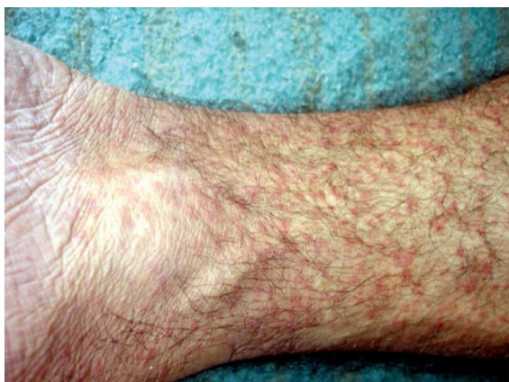
Figura 1 - Rash maculopapular localizado em membro inferior.

cefaléia frontal latejante, a qual estava presente 5 dias antes do início do quadro de artralgia, que melhorou espontaneamente em curto período. Houve emagrecimento de 4 kg desde o surgimento desses sintomas. O paciente era tabagista (um maço de cigarros por dia) há 35 anos e ex-etilista (três litros de destilado por dia durante 33 anos) há 8 anos. Ao exame físico apresentava-se em bom estado geral, tendo sido evidenciada a presença de rash maculopapular no abdome, nos membros superiores e, principalmente, nos membros inferiores. A radiografia de tórax (Figura 2), solicitada em consulta ambulatorial prévia, demonstrava