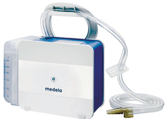
Figura 1 – Sistema digital para drenagem torácica.

Através do visor, podemos obter informações do que ocorre no momento, com a indicação da perda aérea e da pressão de aspiração utilizada. Pelo gráfico, temos as informações do que ocorreu nas últimas 24 h (Figura 2). Assim, durante as visitas médicas ou de enfermagem, podemos consultar essas informações e tomar decisões melhores. Além disso, as informações podem ser exportadas para um computador através do programa ThopEasy (Medela). Assim, obtemos mais parâmetros, como o tempo de drenagem, com a data e a hora inicial e final de uso do sistema, valor máximo e valor mínimo de aspiração e de perda aérea (Figura 2). A aspiração pode ser