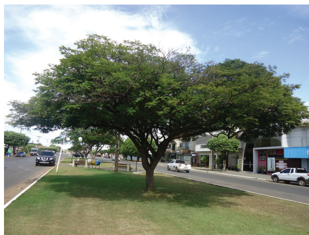
Figura 2. Poincianella pluviosa (Fabaceae). Planta hospedeira de Isogonoceraia divergipennis .

Segundo BURCKHARDT; QUEIROZ (2012), I. divergipennis possui como planta hospedeira a Poincianella pluviosa (Fabaceae) (Fig. 2), conhecida popularmente por sibipiruna, planta nativa do Brasil, alocada principalmente na Mata Atlântica do Rio de Janeiro, sul da Bahia e no Pantanal Matogrossense, que provoca danos em suas folhas (Fig. 3). Sua utilização se dá especialmente para compor o paisagismo urbano, porém, também é indicada para recuperação de áreas degradadas e composição de parques e jardins. De sua madeira provêm caibros e ripas que podem ser utilizados na construção civil ou de móveis (LORENZI, 2009).