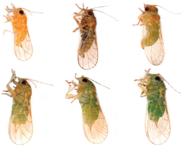
Figura 1. Adultos de Isogonoceraia divergipennis , mostrando a diversidade de cores apresentada pelo inseto.