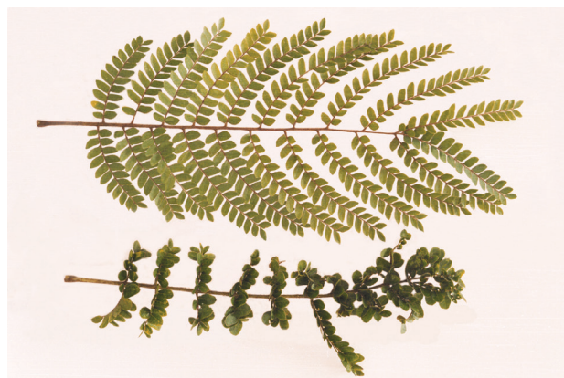
Figura 3. Danos provocados por Isogonoceraia divergipennis em folhas de Poincianella pluviosa .