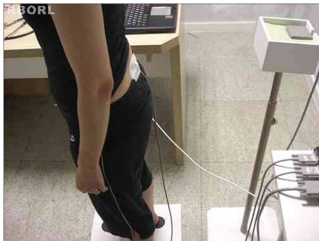
Figura 2. Sensor fixado entre S1 e S2.

Foi considerado deslocamento máximo antero-posterior (cm), a maior amplitude de movimento no sentido anteroposterior (a-p) e deslocamento máximo médio-lateral (cm), a maior amplitude de movimento no sentido médio-lateral (m-l). A trajetória total foi definida como o deslocamento total (cm) realizado pelo corpo durante o tempo de aquisição dos dados nos eixos x, y e z. A velocidade total (cm/s) foi definida como o trajeto total nas três dimensões dividido pelo tempo. As velocidades no sentido anteroposterior (a-p) e médio-lateral (m-l) foram calculadas de acordo com a trajetória nos diferentes eixos em relação ao tempo (cm/s).