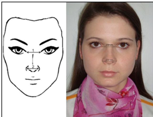
Figura 1 Vista frontal: distância intercantal (1), distância alar (2). Figura da esquerda: modelo esquemático. Figura da direita: uma das voluntárias do estudo.