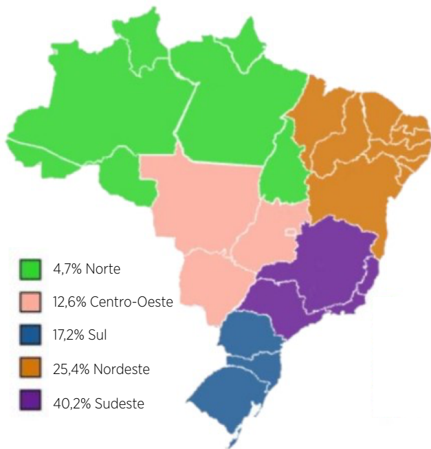
Figura 2. Distribuição por região de disciplinas que abordam a saúde do idoso nos cursos de fisioterapia no Brasil

Ao analisar a associação entre a presença da disciplina que aborda saúde do idoso (geral), específica I e específica II com as regiões onde o curso é ofertado, observou-se associação significativa entre a presença da disciplina que aborda saúde do idoso (geral) e a região Sudeste ( p=0,03 ) (Figura 2).