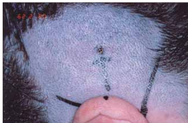
Figura 2. Localização prévia do local onde será fixado o implante.

Após análise dos exames da paciente foi indicado, para o caso, o uso do BAHA Divino da Cochlear, na orelha esquerda, orelha com melhores limiares de via óssea e lado preferido pela paciente durante o teste externo.