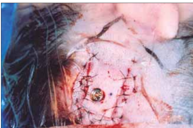
Figura 4. Reposicionamento do retalho com perfuração em sua região central para exteriorização da região externa do implante.