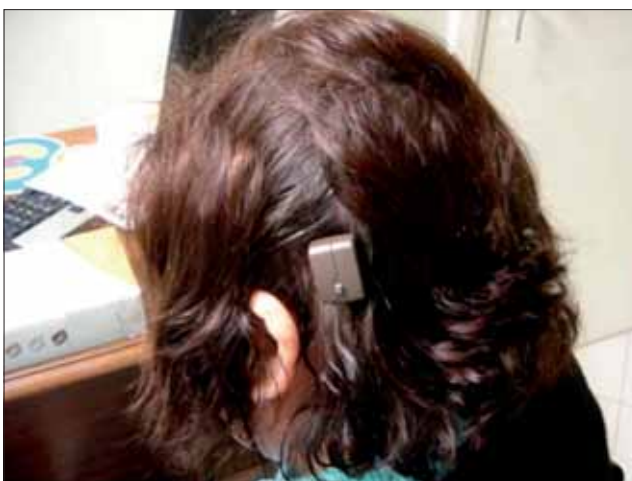
Figura 5. Processador Baha acoplado ao Abbutment.