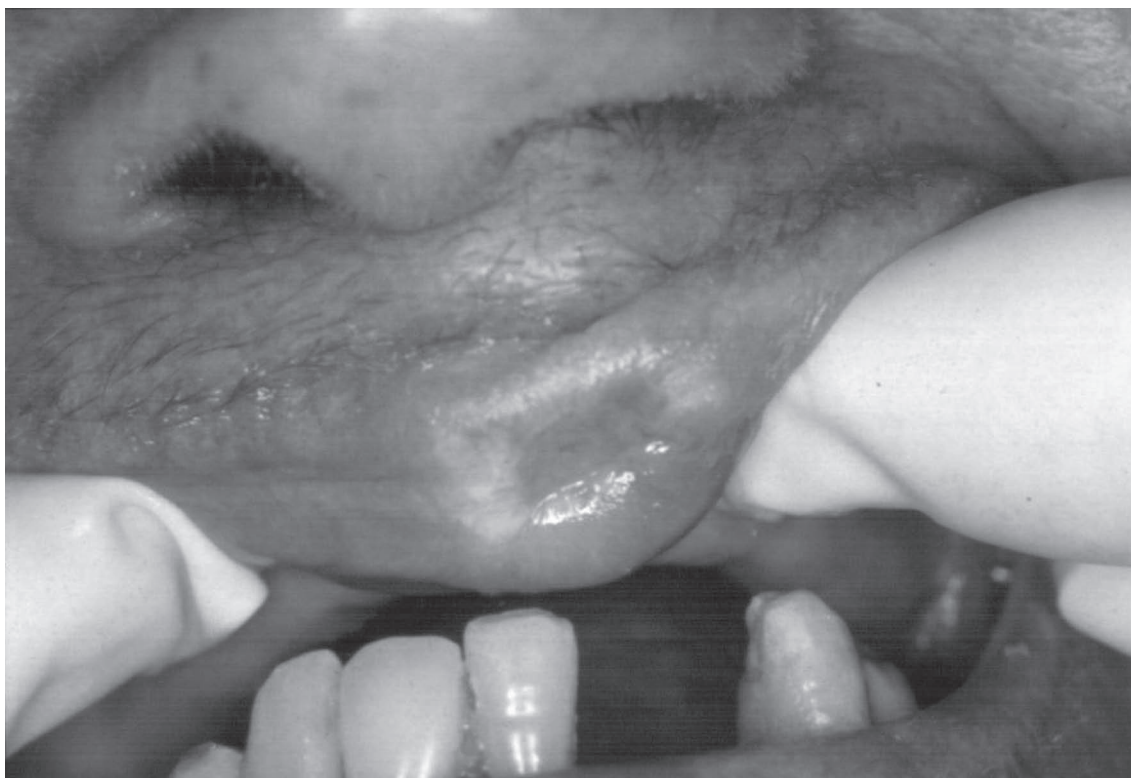
Figura 5 - PB Aspecto da lesão no lábio superior após a extração do incisivo inferior e as sessões de laserterapia.