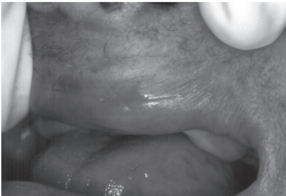
Figura 6 - Aspecto final da lesão do lábio após as extrações dos dentes remanescentes.