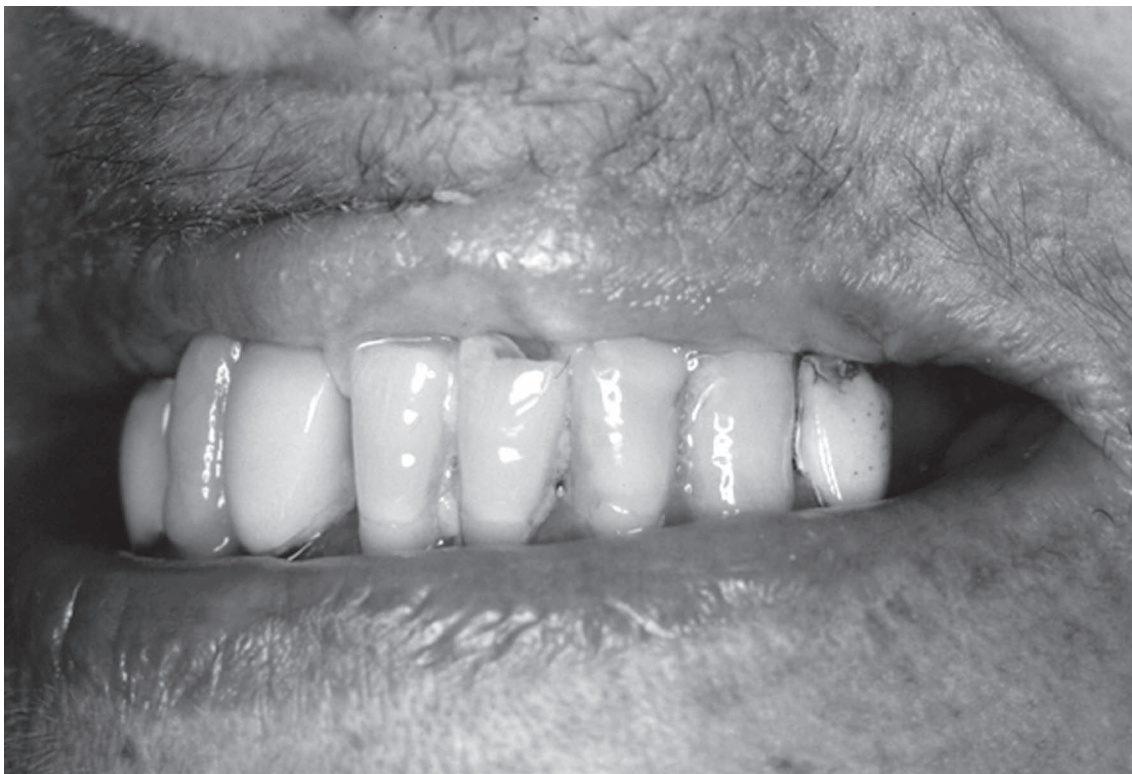
Figura 3 - PB Lesão ulcerativa no lábio superior na região de incisivos inferiores.