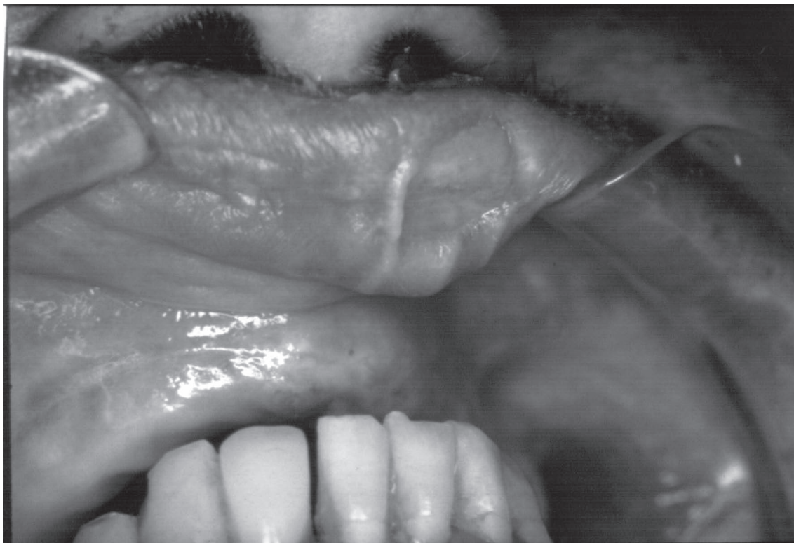
Figura 2 - PB Lesão ulcerativa no rebordo alveolar superior.