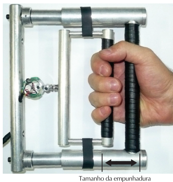
Figura 1. Preensão palmar em um dinamômetro.

A FPM tem sido investigada, principalmente, por meio da medição da força isométrica máxima que pode ser exercida sobre um dinamômetro, em inúmeros padrões de empunhadura ou pegada. A preensão power grip , conhecida como palmar e a mais referenciada na literatura, origina-se do termo grasp , que significa apertar um objeto cilíndrico. Nesse tipo de pegada existe a inibição da ação do polegar, como apresentado na figura 1.