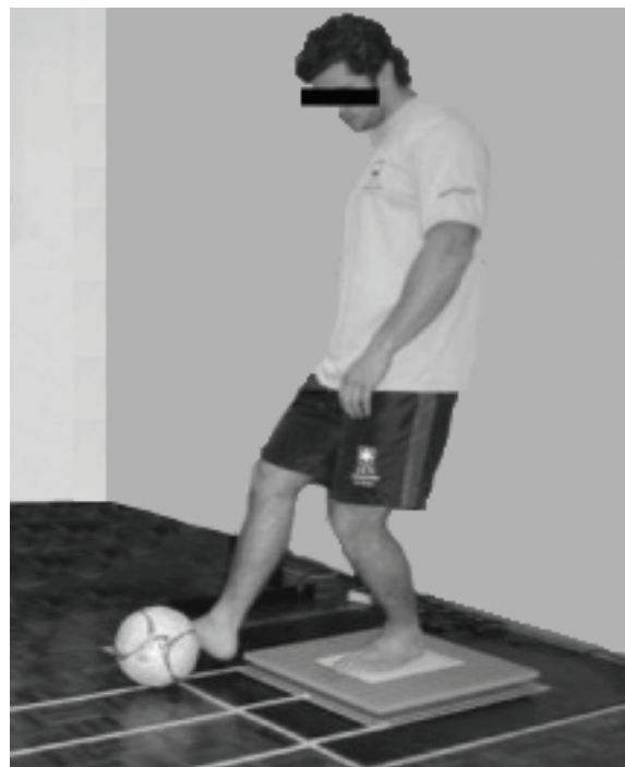
Figura 1. Atleta executando a avaliação estabilométrica.

Os dados foram coletados com frequência de amostragem de 100 Hz e foram selecionados três segundos referentes ao tempo necessário para execução do movimento de passe e restabelecimento da posição inicial para posterior análise, realizada sem qualquer processo de filtragem de sinal. Tendo em vista os objetivos do estudo, optou-se pela análise dos seguintes parâmetros mensurados na avaliação estabilométrica: 1) amplitude total de deslocamento do COP no eixo X (deslocamento médio-lateral, em cm); 2) amplitude total de deslocamento do COP no eixo Y (deslocamento ântero-posterior, em cm); e 3) velocidade média de deslocamento do COP nos três segundos de avaliação do movimento (em cm/s) 20 .