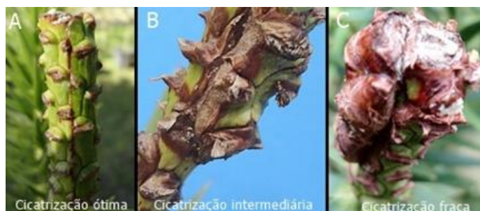
FIGURA 1: Classificação da cicatrização dos enxertos: A) cicatrização ótima (perfeita união enxerto e porta-enxerto); B) cicatrização intermediária (união entre enxerto e porta-enxerto com presença de tecidos ressecados); C) cicatrização fraca (bordas do enxerto desalinhadas com o porta-enxerto e ressecadas).

Os dados foram analisados por meio de estatística descritiva. Foi calculado o coeficiente de correlação de Pearson entre as variáveis “distância dos verticilos até o ápice” e “ângulo da brotação”; “distância dos verticilos” e “comprimento das brotações”.