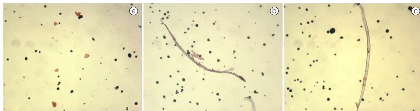
Figura 3. Microscopia óptica (aumento de 100 vezes) de farinhas de mandioca destacando grânulos de amido (azul) e fibras vegetais (vermelho). (a) Farinha Grupo D'água (Farinha D'água ); (b) Farinha Bijusada ( Biju Fina ) e (c) Farinha Seca ( Farinha Fina ).

O amido em estado granular permanece inalterado em razão da resistência estrutural à ação enzimática. Lobo e Silva (2003) e Ramos et al. (2009) ressaltam que esse tipo de amido apresenta propriedades prebióticas, funcionando como fibra alimentar, além de ser convertido em ácidos graxos de cadeia curta.