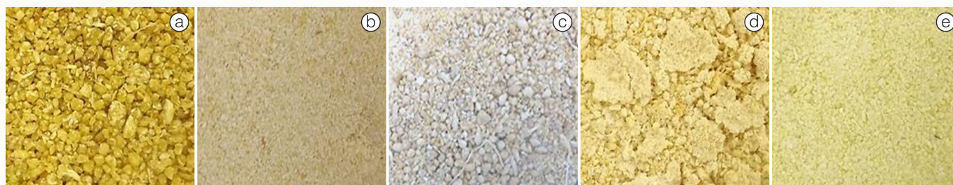
Figura 1. Aspecto das farinhas de mandioca em sua granulometria natural. (a) Farinha D'água ; (b) Farinha Fina ; (c) Farinha Furnas ; (d) Farinha Biju Grossa ; (e) Farinha Biju Fina .

*Média de 5 repetições. Letras diferentes nas colunas indicam que os resultados são estatisticamente diferentes pelo teste de Tukey a 5% de probabilidade ( p < 0,05 ).