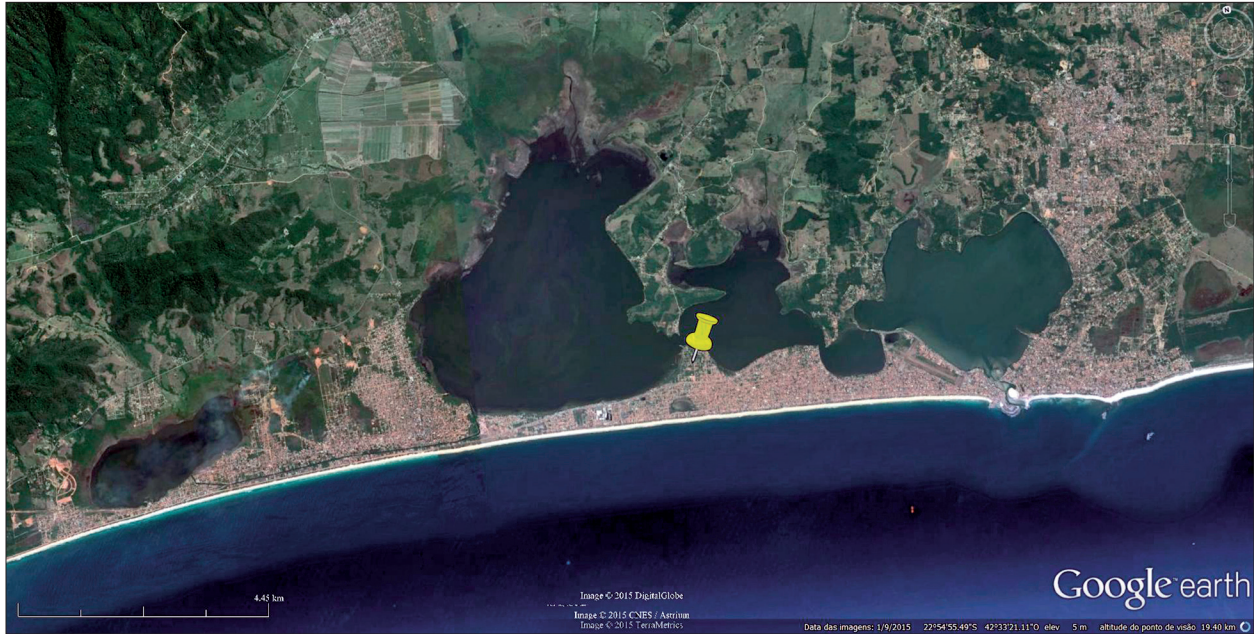
Mapa 3. Lagoa de Saquarema (RJ) e localização do sambaqui da Beirada.