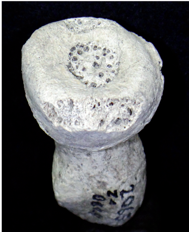
Figura 1. Epífise distais de ulnas apresentando comprometimento articular intenso com eburnação extensa - sambaqui Ilhote do Leste (RJ).