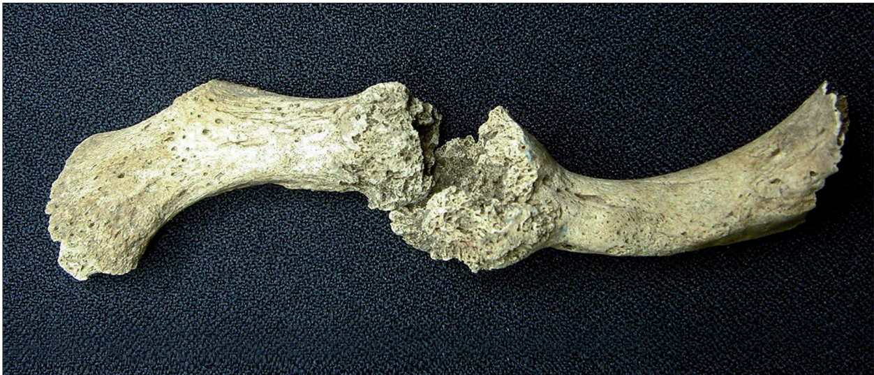
Figura 5. Fratura em clavícula esquerda apresentando pseudoartrose – sambaqui da Beirada (RJ). Foto: A. Lessa. Acervo: Museu Nacional/UFRJ.