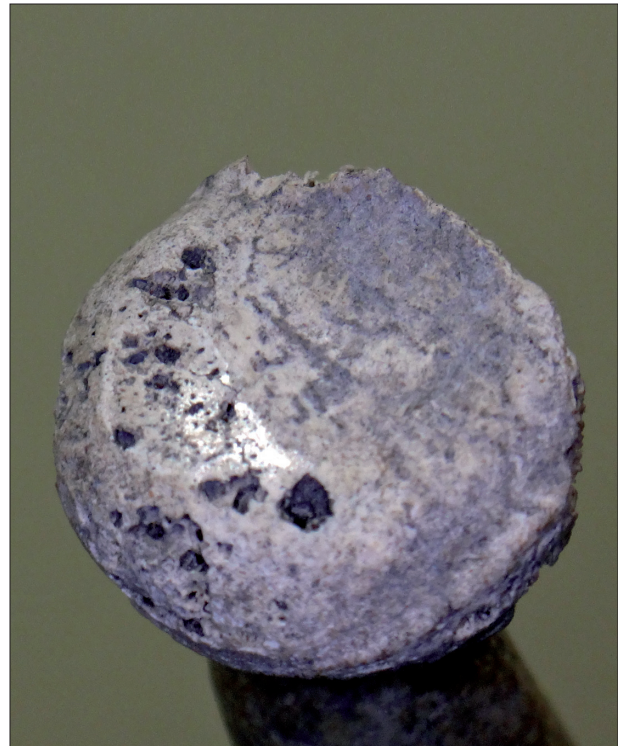
Figura 2. Epífise proximal de rádio apresentando comprometimento articular moderado com porosidade - sambaqui Zé Espinho (RJ).