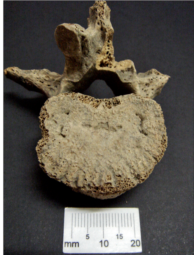
Figura 4. Nódulo de Schmorl na superfície inferior do corpo de L3 – sambaqui Zé Espinho (RJ).