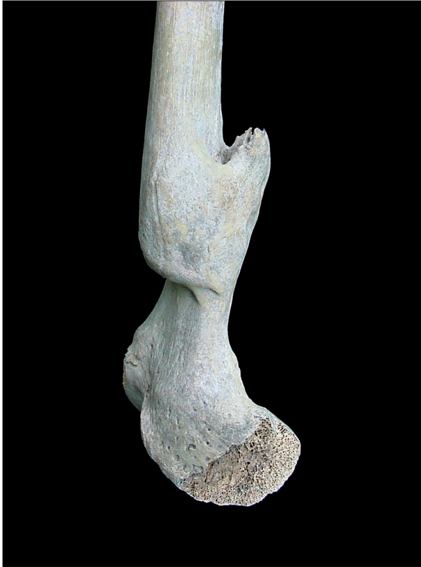
Figura 6. Fratura em fêmur direito apresentando mal alinhamento dos segmentos ósseos – sambaqui Zé Espinho (RJ).

Para a investigação do comprometimento articular foram consideradas bilateralmente as seis principais articulações dos membros superiores e inferiores, ou seja, ombro, cotovelo, punho, quadril, joelho e tornozelo. As alterações ósseas indicativas de comprometimento articular foram presença de porosidade na superfície articular, definição das margens articulares com afilamento de suas bordas, presença de projeção óssea acentuada e eburnação. Tais alterações foram consideradas para estabelecimento de uma classificação do comprometimento articular em quatro níveis, a saber: sem CA, CA leve, CA moderado e CA intenso.