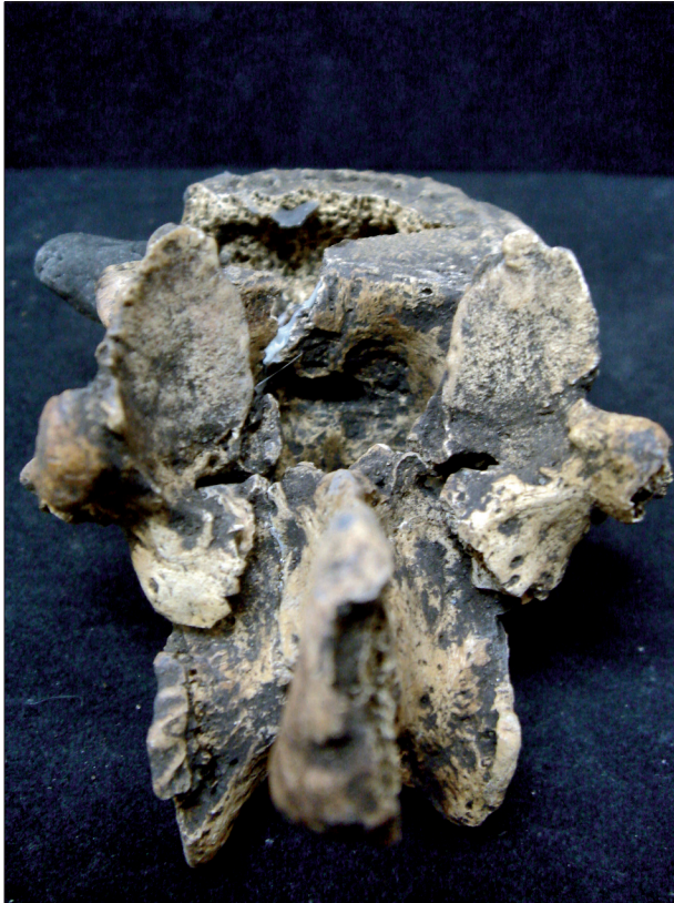
Figura 3. Espondilólise bilateral completa em vértebra lombar – sambaqui Ilhote do Leste (RJ).