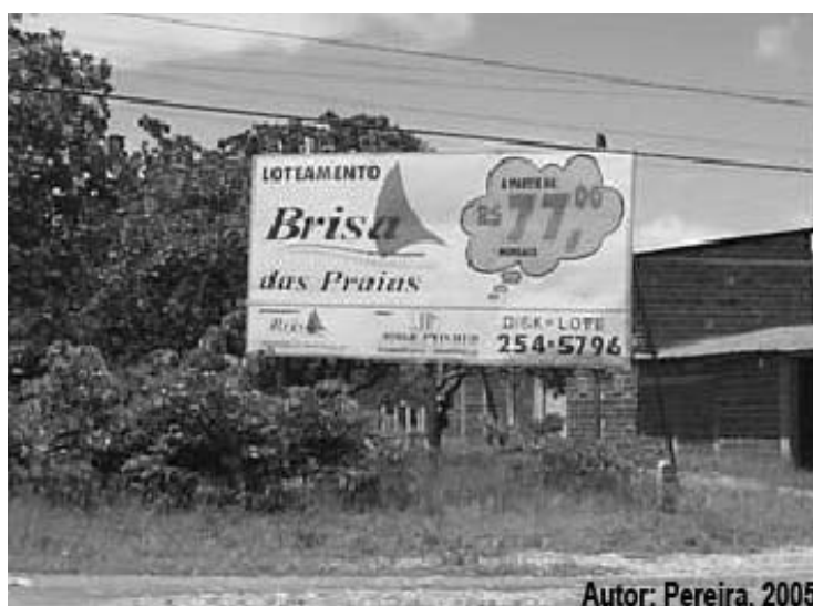
Figura 3. Outdoors na CE 040, distrito Sede.

Os parcelamentos são anunciados em placas à margem das rodovias estaduais e em sua sede em Fortaleza.