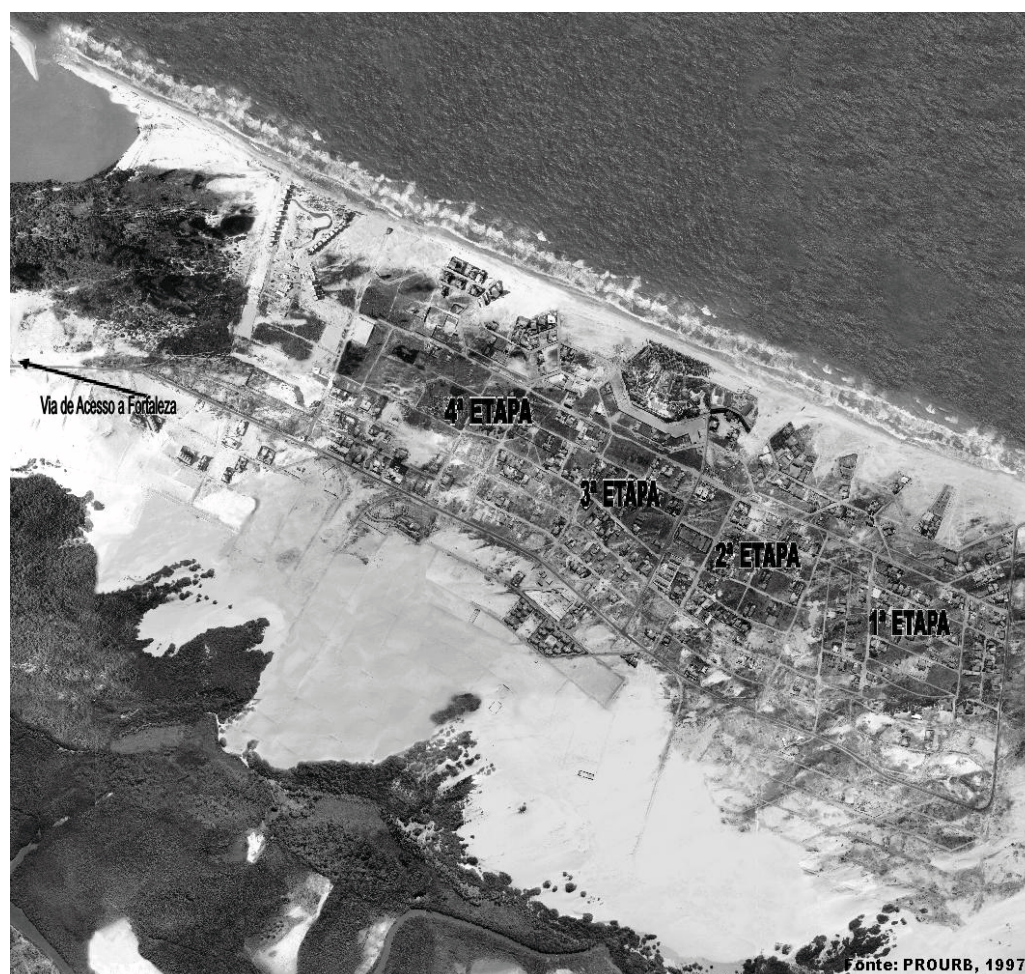
Figura 2. Foto aérea do loteamento Porto das Dunas em Aquiraz/CE.

vendas, tratando-se, de acordo com informações da área técnica municipal, do “carro-chefe” de vendas no Município. Na figura 2 pode-se visualizar o traçado urbano linear do referido empreendimento, ligado à Fortaleza pela CE 025 (indicação da seta).