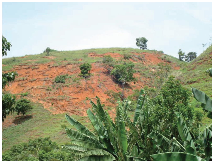
FIGURA 3: Erosão laminar do solo oriundos do processo de mau uso do solo na bacia do Córrego Santa Maria no noroeste do Estado do Rio de Janeiro.

* No uso e ocupação do solo atual, a classe área de preservação permanente é inexistente.