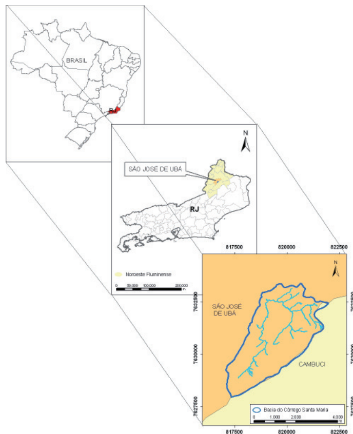
FIGURA 1: Localização geográfica da bacia hidrográfica do Córrego Santa Maria no Município de São José de Ubá no noroeste do Estado do Rio de Janeiro.

A bacia do Córrego Santa Maria localiza-se totalmente no Município de São José de Ubá, na região noroeste do Rio de Janeiro que é denominada de noroeste fluminense, apresentando uma área de 13,56 Km 2 ou 1.356 ha, como pode ser visto na FIGURA 1.