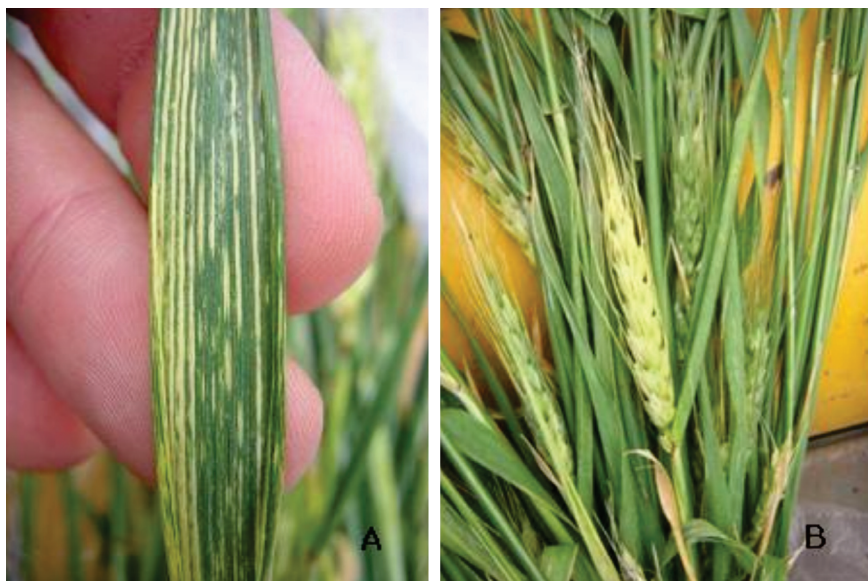
FIGURA 1 - Síntomas de Barley yellow striate mosaic virus en trigo infectado naturalmente. A. síntoma de estrías cloróticas en la hoja bandera; B. síntoma de espiga amarilla en plantas enfermas.

Se realizaron recolecciones en lotes de trigo (tres muestras por localidad) que presentaban síntomas de mosaico estriado y espigas amarillas y vanas (Figura 1), en las provincias de Buenos Aires (Miramar y Balcarce), Córdoba (Río Cuarto Marcos Juárez y Rosales), Entre Ríos