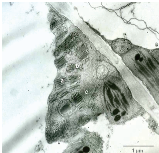
FIGURA 2 - Observación al microscopio electrónico de cortes ultrafinos e identificación de partículas virales baciliformes en el citoplasma de las células en relación a membranas del Retículo Endoplasmático. A. partículas virales agregadas dispuestas longitudinalmente; B. corte transversal; C. material fibrilar en el viroplasma.

Transmisión natural: de los 75 delfácidos recolectados en lotes de la localidad de Río Cuarto, 68 fueron identificados como D. kuscheli , tres como P. tigrinus , dos como T. propinqua y dos como C. haywardi . Del total de plantas de cebada evaluadas en las transmisiones llevadas a cabo por estas especies, tres plantas resultaron positivas para BYSMV por ELISA indirecto. Dichas plantas correspondieron a las transmitidas por D. kuscheli y mostraron estrías cloróticas, amarillamiento de las hojas, enanismo y arrosetamiento, característico de los síntomas de la enfermedad encontrada a campo.