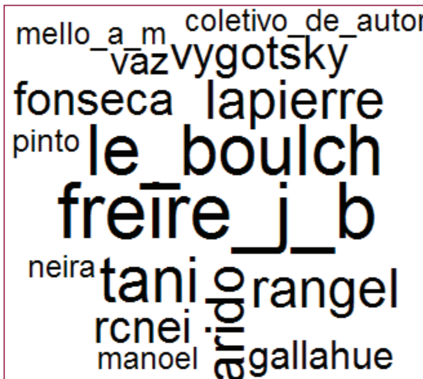
Imagem 3 – Nuvem de palavras das bibliografias

A Imagem 3, a seguir, apresenta a nuvem de palavras proveniente das bibliografias presentes nos documentos pesquisados. Por meio dela, é possível constatar os referenciais que dão suporte às disciplinas analisadas: