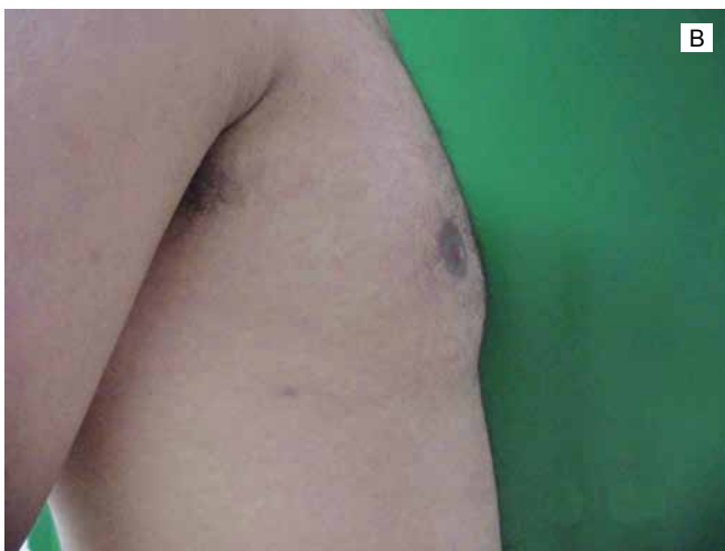
Figura 2 - Ginecomastia grau II, A: Vista no pré-operatório e B: No pós-operatório tardio.