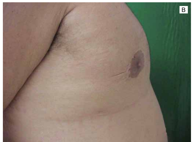
Figura 3 - Ginecomastia grau III, A: Vista no pré-operatório e B: No pós-operatório tardio.

No pós-operatório, os pacientes foram orientados a utilizar malha compressiva durante um mês. As atividades físicas foram suspensas por quatro semanas após a cirurgia. O acompanhamento dos pacientes foi de um ano.