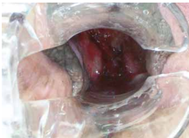
Figura 9 - Aspecto da neovagina ao exame especular no 40º dia de pós-operatório, evidenciando a permeabilidade.