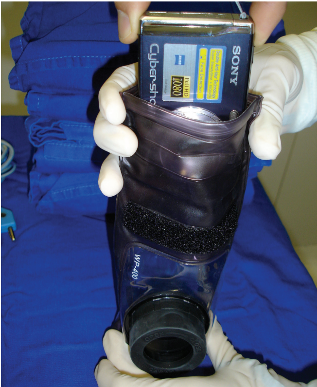
Figura 1 – Introdução da máquina de fotografia na capa à prova de água durante a montagem da mesa de instrumental cirúrgico.