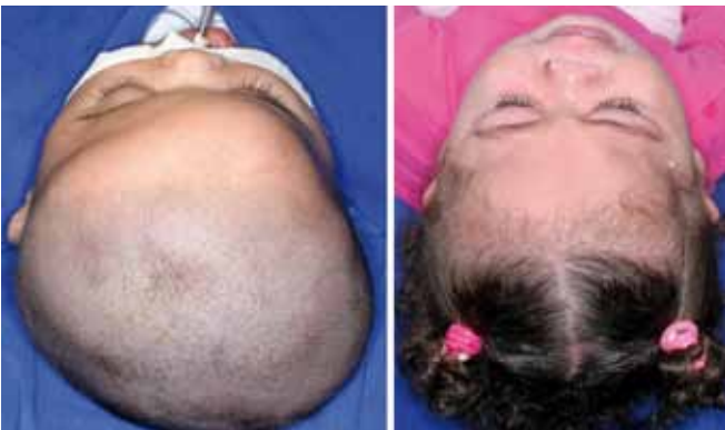
Figura 6 – Visão pré-operatória superior de outro paciente com craniossinostose coronal unilateral submetida à cirurgia aos 3 meses de idade (direita). Visão pós-operatória superior. Observa-se significativa melhora do contorno fronto-parietal (esquerda).

Visão pós-operatória superior (esquerda). Observa-se por outro ângulo fotográfico melhora significativa do contorno da região frontal.