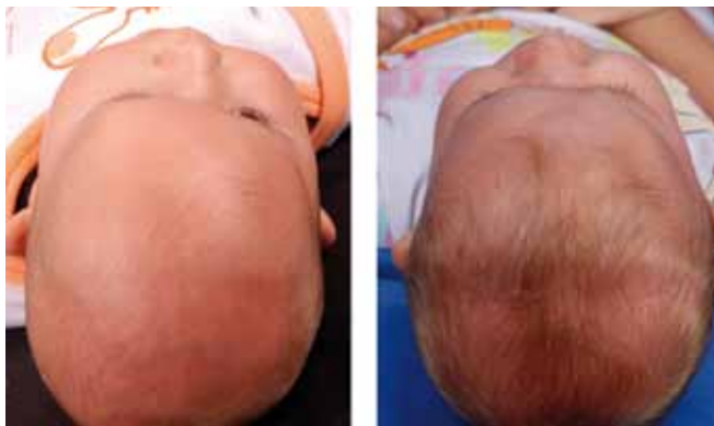
Figura 5 – Visão pré-operatória superior do mesmo paciente (direita).

Fotografia pós-operatória do mesmo paciente após a cirurgia para a correção da craniossinostose (esquerda). Nota-se melhora significativa do contorno da região frontal e da distopia orbitária.