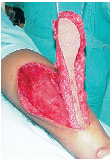
Figura 5 – Modificações introduzidas na técnica. Dissecção de borda fasciossubcutânea ao redor da pele do retalho, para melhorar a circulação e deixar uma faixa de pele sobre o pedículo, para evitar o enxerto de pele sobre o mesmo.