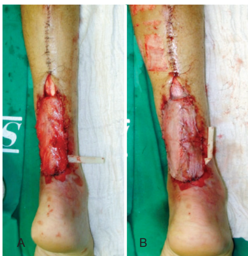
Figura 6 – Retalho fasciossubcutâneo. Em A , em ferimentos no calcânhar ou sobre o tendão calcâneo inferior, a melhor opção é fazer o retalho fasciossubcutâneo dobrando-o sobre o ponto de rotação, como folha de livro, ficando a superfície fascial voltada para cima, face que recebe um enxerto de pele. Nesses casos, deve-se remover a pele do retalho e do pedículo. Em B , retalho após o enxerto de pele.

No total, foram realizados 52 retalhos fasciocutâneos e 9 fasciossubcutâneos. As áreas tratadas foram o pé em 17 casos (10 calcânhar e 7 dorso do pé) e o terço distal da perna em 44 (9 anterior, 21 anteromedial, 5 anterolateral, 6 medial e 3 lateral).