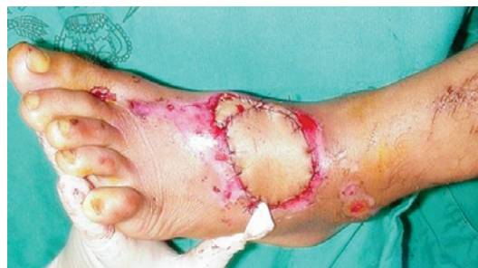
Figura 7 – Retalho transposto através de túnel subcutâneo. Para se evitar a cicatriz entre o ponto de rotação do retalho e a ferida, pode-se transpor o retalho através de um túnel subcutâneo. Aumenta-se, porém, o risco de compressão do pedículo em decorrência de edema tecidual, levando o retalho a congestão vascular. Nesses casos, também não se deixa a faixa de pele no pedículo.

No total, foram realizados 52 retalhos fasciocutâneos e 9 fasciossubcutâneos. As áreas tratadas foram o pé em 17 casos (10 calcânhar e 7 dorso do pé) e o terço distal da perna em 44 (9 anterior, 21 anteromedial, 5 anterolateral, 6 medial e 3 lateral).