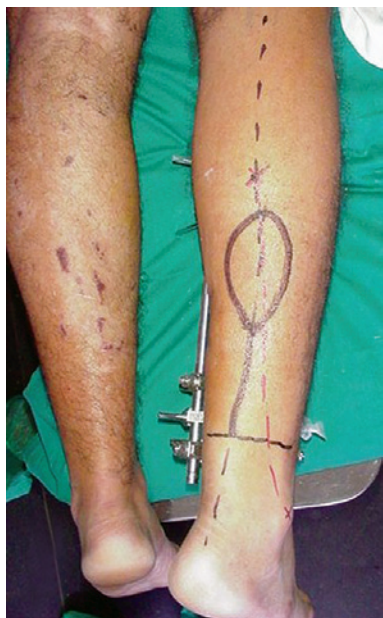
Figura 1 – Marcação do retalho. Ponto de rotação 5 cm acima do maléolo lateral (limite da dissecação do pedículo). O comprimento do pedículo é igual à distância entre o ponto de rotação do retalho e a ferida. O tamanho do retalho é igual ao tamanho da ferida.