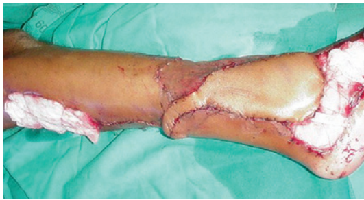
Figura 9 – Faixa de pele sobre o pedículo. Modificação acrescentada à técnica do retalho, deixando uma faixa de pele sobre o pedículo, o que o torna mais firme e protegido, evitando acotovelamentos e dispensando o enxerto de pele sobre o mesmo.