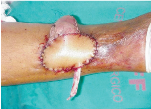
Figura 8 – Retalho sural de fluxo reverso em ilha, com enxerto sobre o pedículo do retalho, como realizado na técnica tradicional.