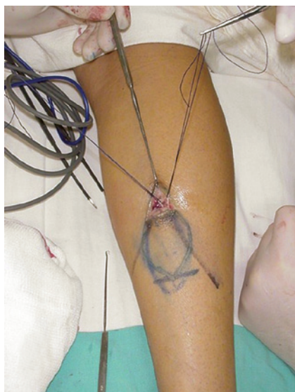
Figura 2 – Início da dissecação do retalho. Inicia-se a dissecação pela borda superior, de forma biselada para cima, com o objetivo de criar uma borda fasciossubcutânea além da borda cutânea do retalho.

de transposição realizada dobrando-se o pedículo sobre ele mesmo (tipo folha de livro) ou por túnel subcutâneo, a faixa de pele do pedículo deve ser removida (Figuras 6 e 7). Faixa de Smarch e manguito pneumático foram utilizados somente