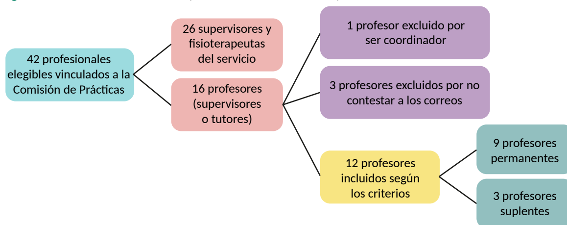
Figura 1. Criterios de selección de profesores vinculados a la práctica

Para ser incluidos en el estudio, además de dar el consentimiento, los estudiantes deben estar realizando prácticas supervisadas –que ocurre en el noveno o décimo período del curso– en atención primaria, secundaria o terciaria. Se excluiría a los estudiantes sin experiencia de práctica, aunque estuvieran en el noveno o décimo período, y los que no hubieran estudiado en la IES investigada desde el inicio de la graduación, pero nadie se encontraba en estas situaciones.