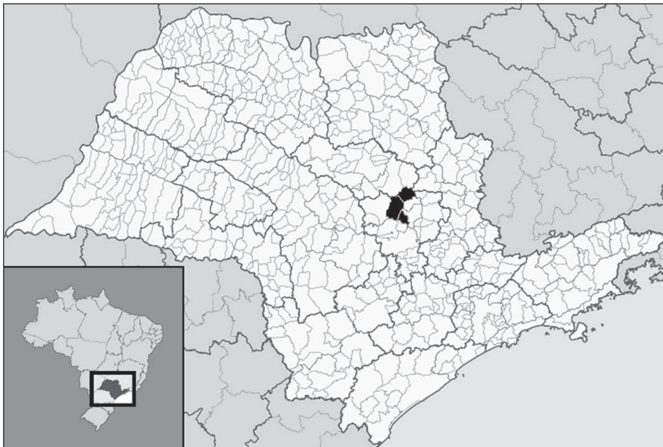
Figura 1. Localização dos municípios de Analândia, Itirapina e Ipeúna em negro, na região Centro-Leste do estado de São Paulo, de cima para baixo respectivamente no mapa.

As coordenadas dos locais de captura foram obtidas por meio de aparelho GPS Garmin Etrex® (Global Positioning System) e,