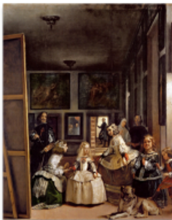
Figura 1 – As Meninas, Diego Velázquez