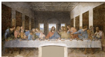
Figura 3 – A última ceia, Leonardo da Vinci