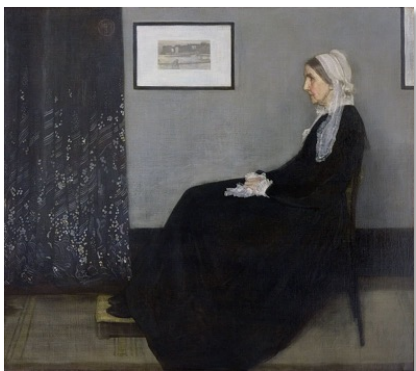
Figura 7 – Arranjo em Cinza e Preto nº 1, James McNeill Whistler