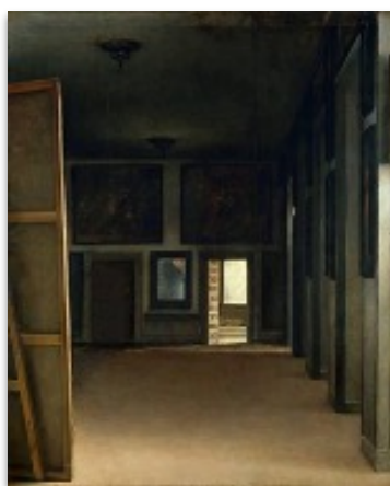
Figura 2 – Palácio real