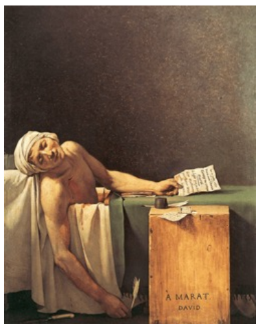
Figura 9 – A morte de Marat, Jacques-Louis David