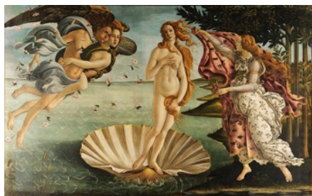
Figura 5 – O nascimento de Vênus, Sandro Botticelli