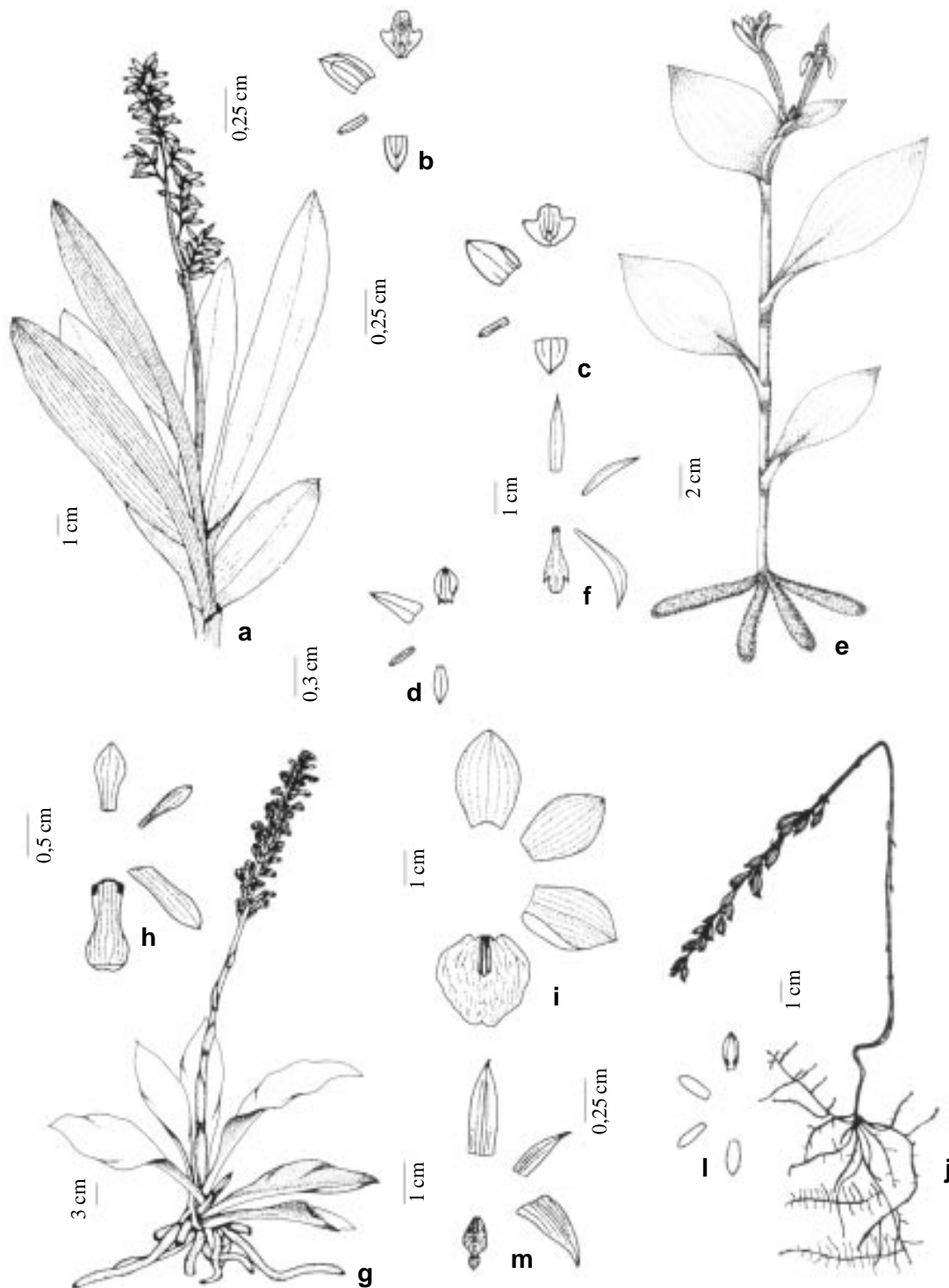
Figura 3. a-b. Polystachya concreta ; c. P. micrantha ; d. Prescottia stachyodes .; e-f. Psilochilus modestus ; g-h. Sauroglossum nitidum ; i. Warrea warreana ; j-l. Wulschlaegelia aphylla ; m. Xylobium variegatum .